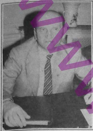
Domnul Președinte, doamnelor și domnilor senatori

Declarația mea de astăzi se vrea o replică la declarația politică de săptămâna trecută a unui distins fruntaș al PDSR. Domnia sa a încercat în lipsa specialistului de serviciu - mă refer la distinsul domn senator Gh. Dumitrașcu - să lămurească electoratul ce imensă gafă a făcut votând la alegerile locale din anul 1992 candidații ai CDR. Încerca domnia sa să demonstreze zor nevoie că primarii, viceprimarii și consilierii Convenției s-au dovedit o adevărată pacoste pe capul localităților care i-au ales. Nu s-a dat în lături nici de la afirmații calomnioase susținând că reprezentanții opoziției în administrația locală nu au făcut altceva decât să se