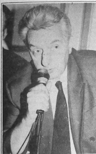
Domnule președinte, Stimați colegi,

Această declarație este de fapt o pledoarie pe care o fac în fața dvs, deoarece, în ciuda faptului că reprezentăm partide și culori diferite și poate chiar interese diferite, avem totuși datoria ca prin activitatea noastră, prin legile pe care le dăm și modul cum verificăm aplicarea lor în teritoriu, să venim în ajutorul celor care ne-au ales a căror viață este din ce în ce mai grea, atât datorită situației economice grele pe care o generează actuala fază de tranziție, cât mai ales datorită corupției, abuzurilor, încălcării unor legi și principii morale fundamentale și nesocotirea muncii, a muncii cinștite, care ar trebui să fie principala sursă de