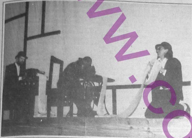
Scenă din spectacolul „17 acte cu Piet Mondrian”, în regia lui Horațiu Mihaiu, laureat al premiului „Alternative”, în cadrul Galei UNITER

Premiilor UNITER revarsă potop de nestăvilite emoții, dăruite bucurii ori înlăcrimate gratitudini. Nimic nu lipsește, nimeni nu este uitat, mereu se adaugă gesturi inedite, invitații de prestigiu, surprize. Noutățile serii de 26 februarie aveau să le aducă cele două premii acordate pentru întâia dată: unul omagiază generozitatea, celălalt vine în întâmpinarea tendințelor novatoare.