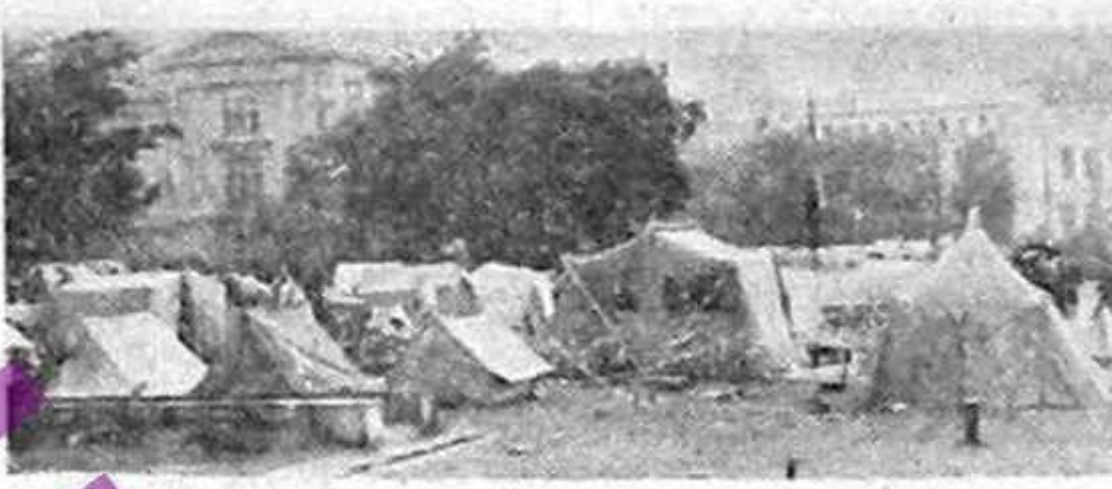
Piața Universității, ultimul bastion al adevărului, dreptății și libertății, ultima zonă neînținută de comunism...