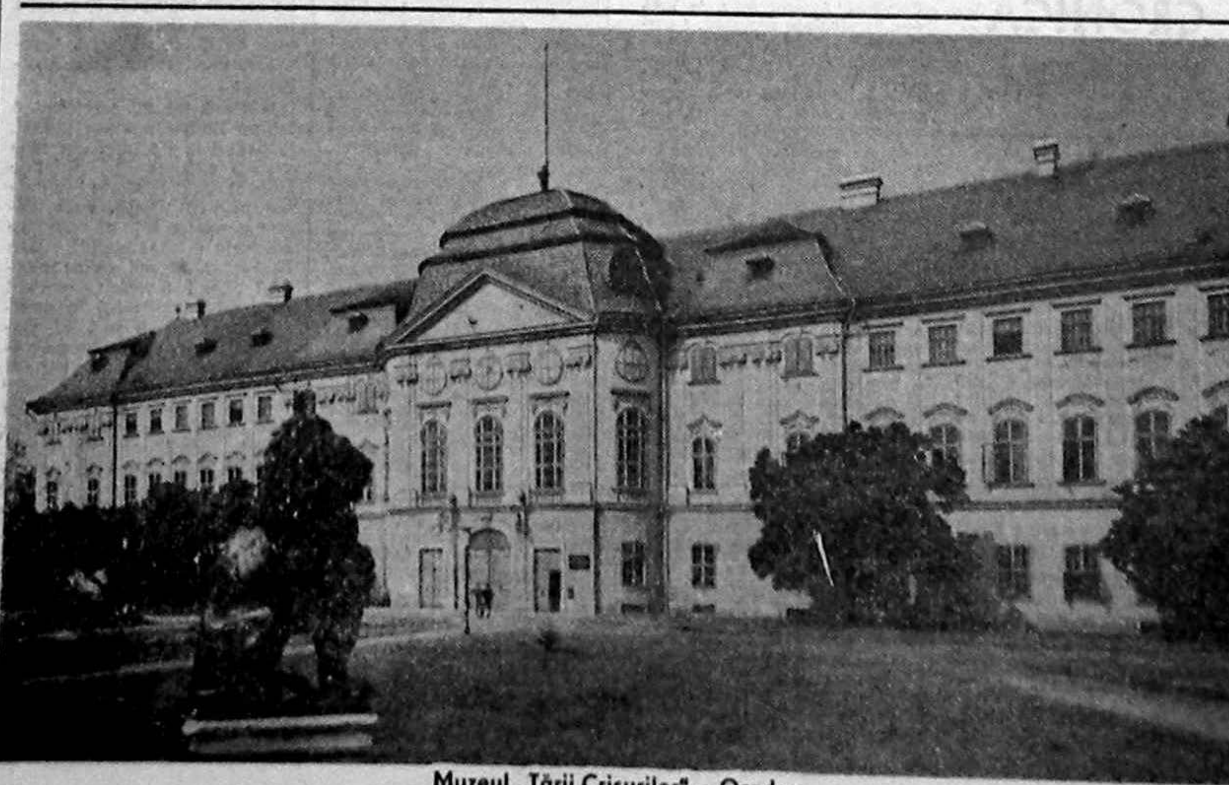
Muzeul „Țării Crișurilor” — Oradea