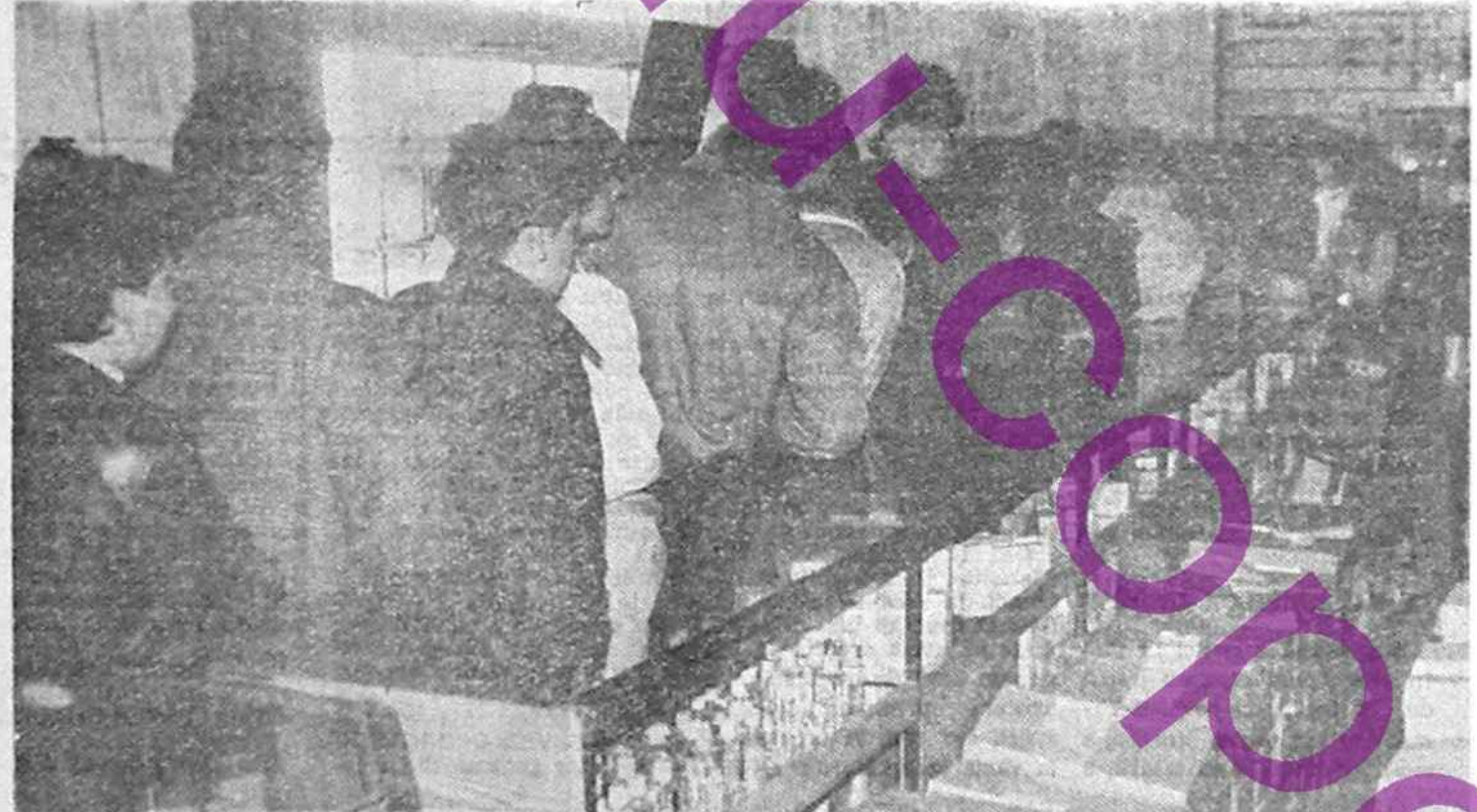
Coadă la raionul „Cosmetice femei” (UNIREA) unde s-a primit pudră pentru nou-născuţi