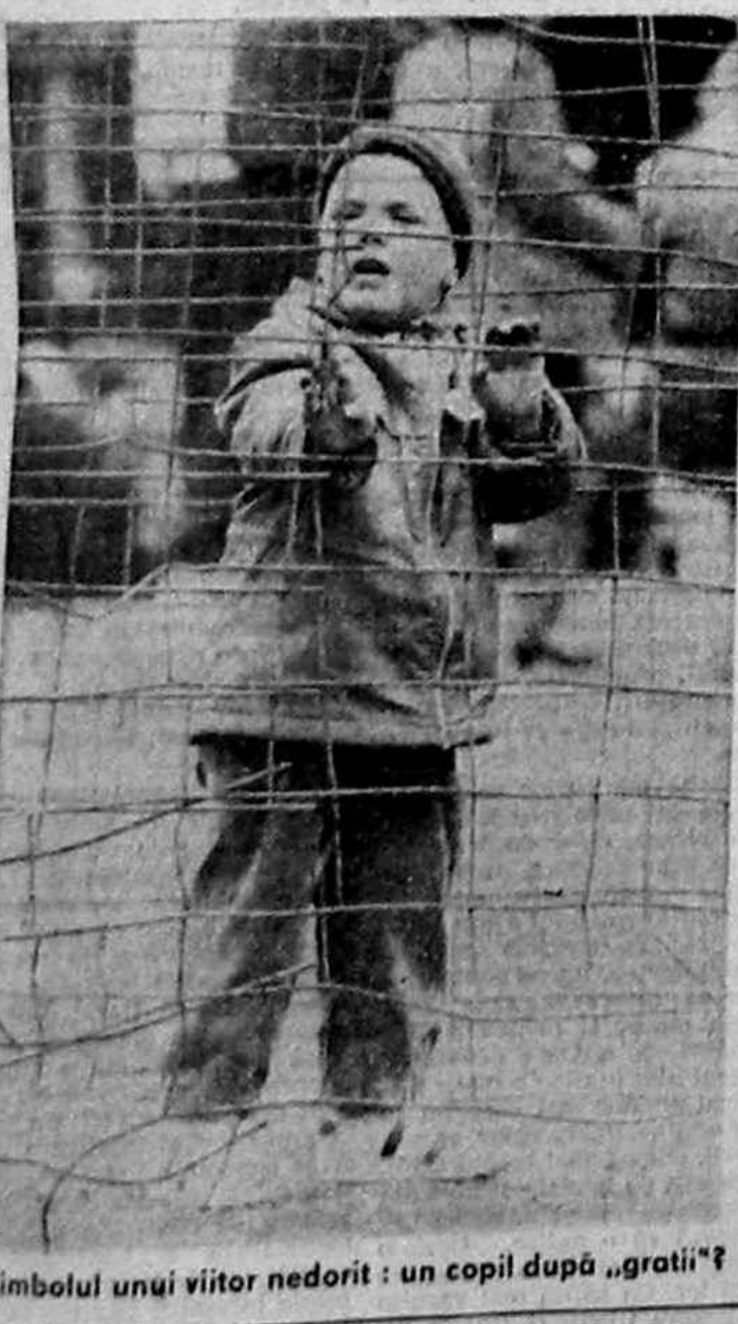
Simbolul unui viitor nedorit : un copil după „gratii”?