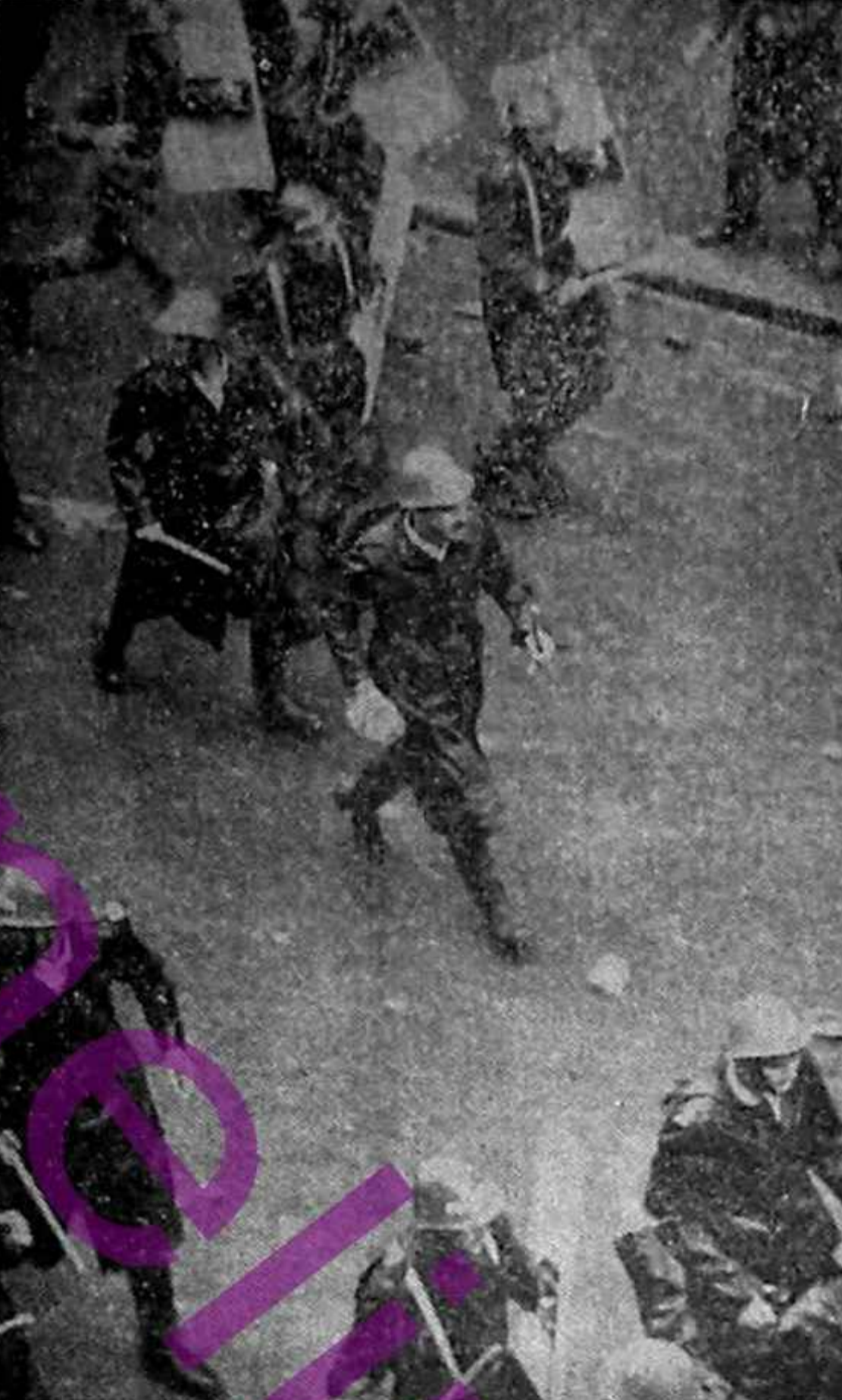
Zilele negre ale Capitalei