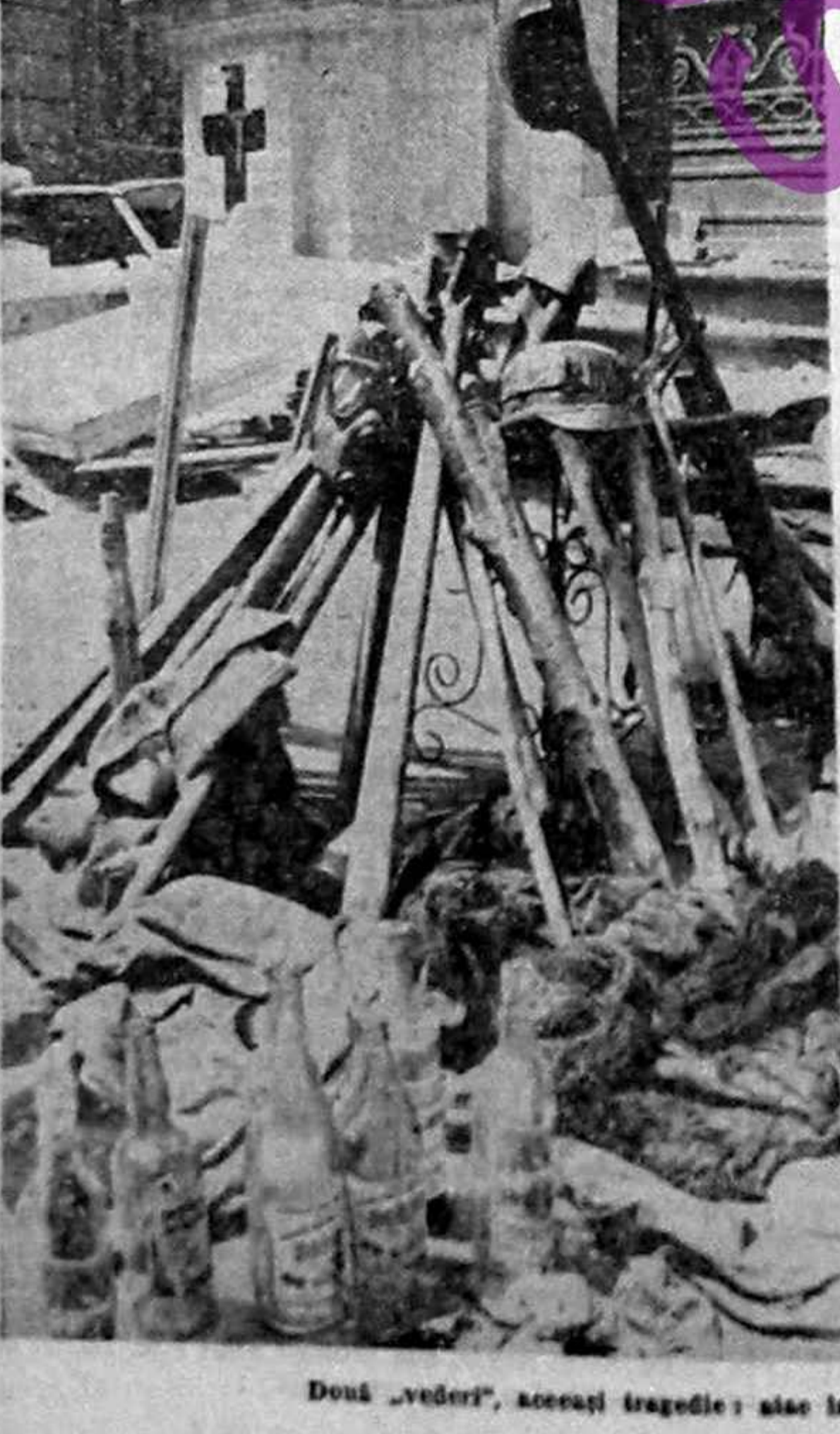
Doză „veder”, aceeași tragedie: alieii în persoană și unelte de muncă devenite arme.