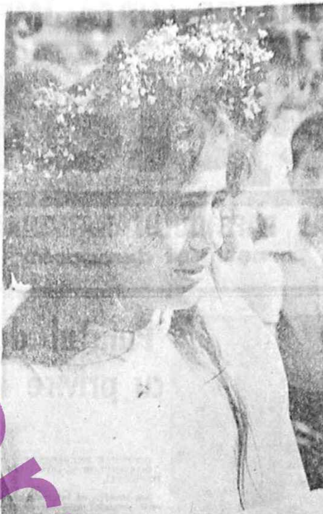
O coronjiță cu... lacrimi