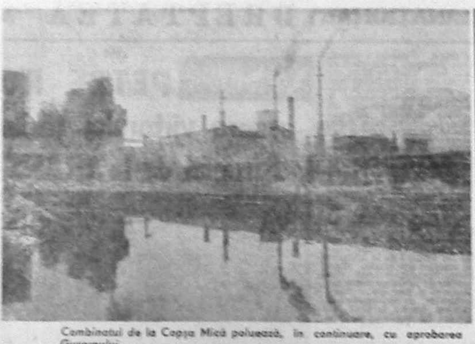
Comitetul de la Copșa Mică poluează, în continuare, cu aprobarea Guvernului

Declarația-program a Guvernului este un document de mare importanță, care trebuie să fie vădită și înțelesă de toți românii. Este un document care trebuie să fie vădit și înțeles de toți românii. Este un document care trebuie să fie vădit și înțeles de toți românii. Este un document care trebuie să fie vădit și înțeles de toți românii. Declarația-program a Guvernului este un document de mare importanță, care trebuie să fie vădit și înțeles de toți românii. Este un document care trebuie să fie vădit și înțeles de toți românii. Este un document care trebuie să fie vădit și înțeles de toți românii. Este un document care trebuie să fie vădit și înțeles de toți românii. Declarația-program a Guvernului este un document de mare importanță, care trebuie să fie vădit și înțeles de toți românii. Este un document care trebuie să fie vădit și înțeles de toți românii. Este un document care trebuie să fie vădit și înțeles de toți românii. Este un document care trebuie să fie vădit și înțeles de toți românii.