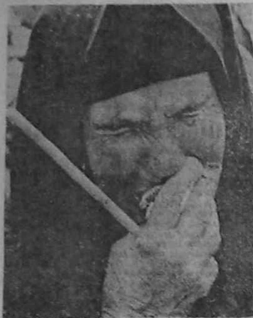
PESTE O MIE DE OAMENI AU PARTICIPAT DUMINICĂ LA TIMISOARA LA DEPUNEREA DE COROANE PENTRU „EROII REVOLUȚIEI POPULARE”