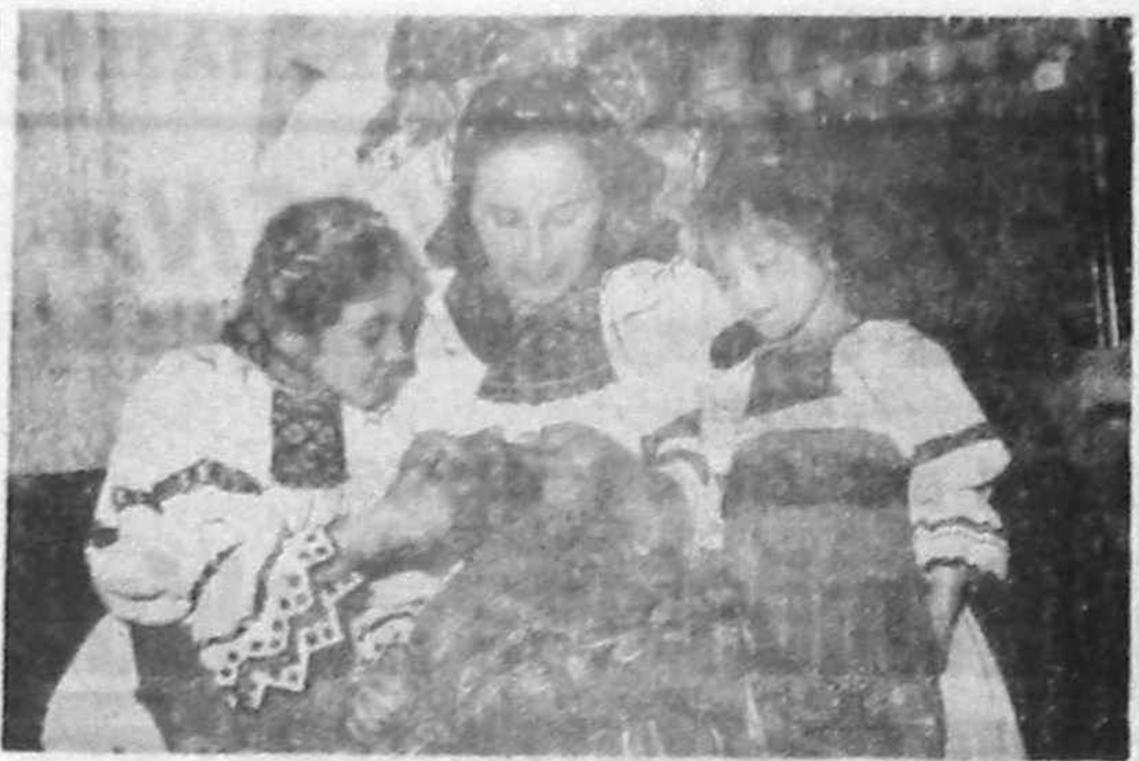
Hârnicia și tradiția se transmit de la mamă la fiică