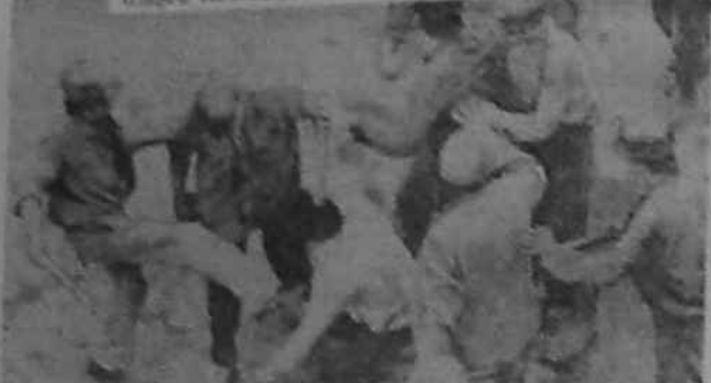
Iliescu schaltet auf hart: Kruppel und Panzer in Bukarest