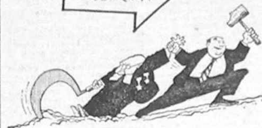
THEMA DES TAGES