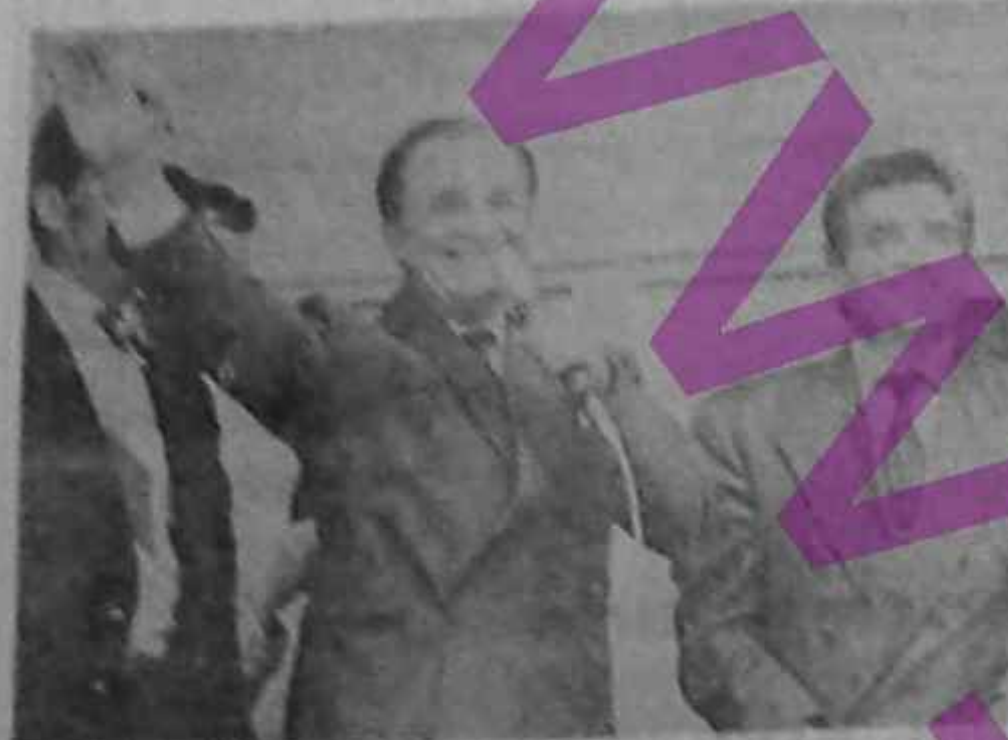
Președintele de stat român Ion Iliescu și șeful guvernului Petre Roman în postură de invingători în baloanelor câștigate după investitura ceremonială.

ÖSTERREICH UNABHÄNGIGE TÄGEBLATT FÜR WIRTSCHAFT, POLITIK UND KULTUR