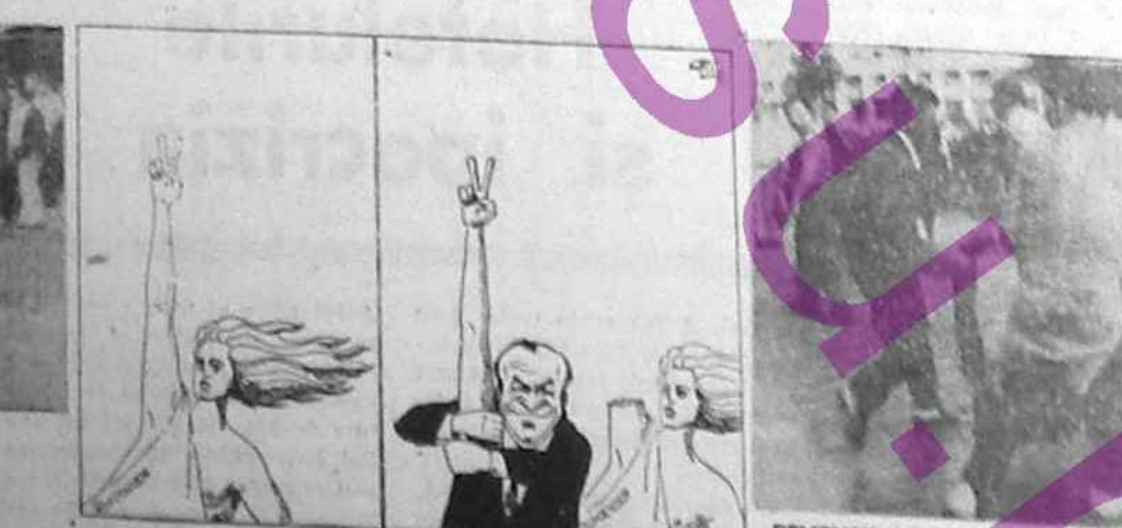
DEMONSTRANȚI DUC ÎN MURIBUNDA, PRATE ÎNTRU ACELAȘI CREDINȚĂ.