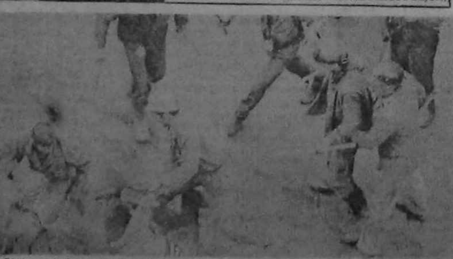
Și înarmați cu rânghi, minerii îi băteau pe demonstrații din București