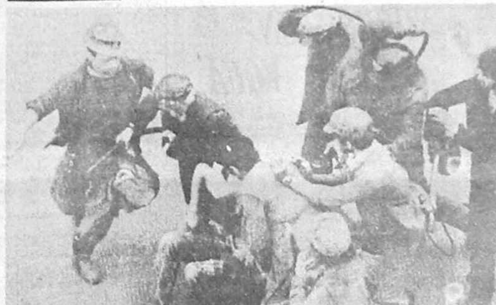
„ NU NE RAMINE DECIT FUGA! ”

KURIER-Augenzeugenbericht aus Bukarest: Die blutige Bilanz der jüngsten Unruhen