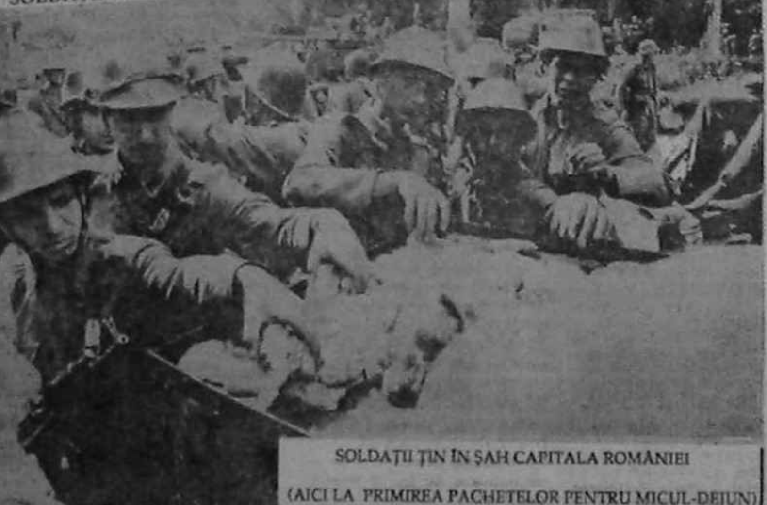
SOLDATII ȚIN ÎN ȘAH CAPITALA ROMÂNIEI (AICI LA PRIMIREA PACHETELOR PENTRU MICUL-DEJUN)

SOLDATII PĂZESC LINISTEA ÎNCORDATĂ PE STRĂZILE BUCUREȘTIULUI