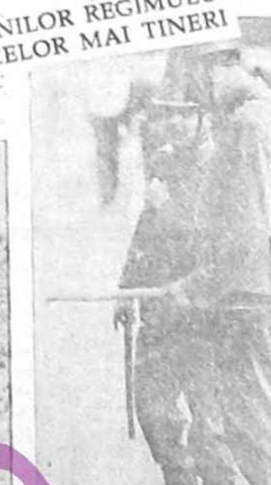
Soldaten-Patrouille (F. J. Bild: AP, USA)