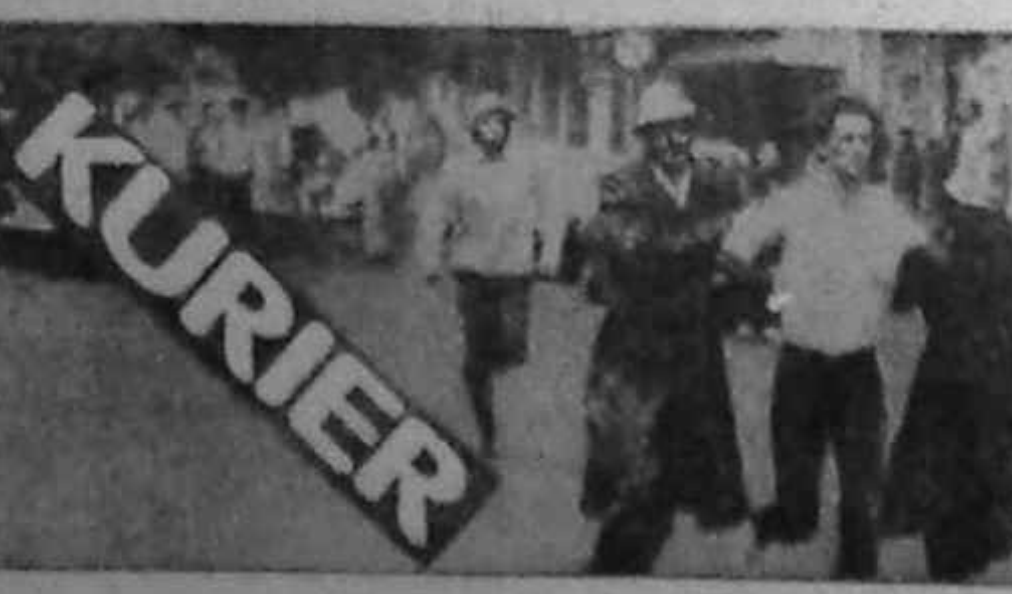
DEMONSTRANT ARSTAT DE POLIȚIST ÎN FUNDAL ARDE O MAȘINĂ A POLIȚIEI