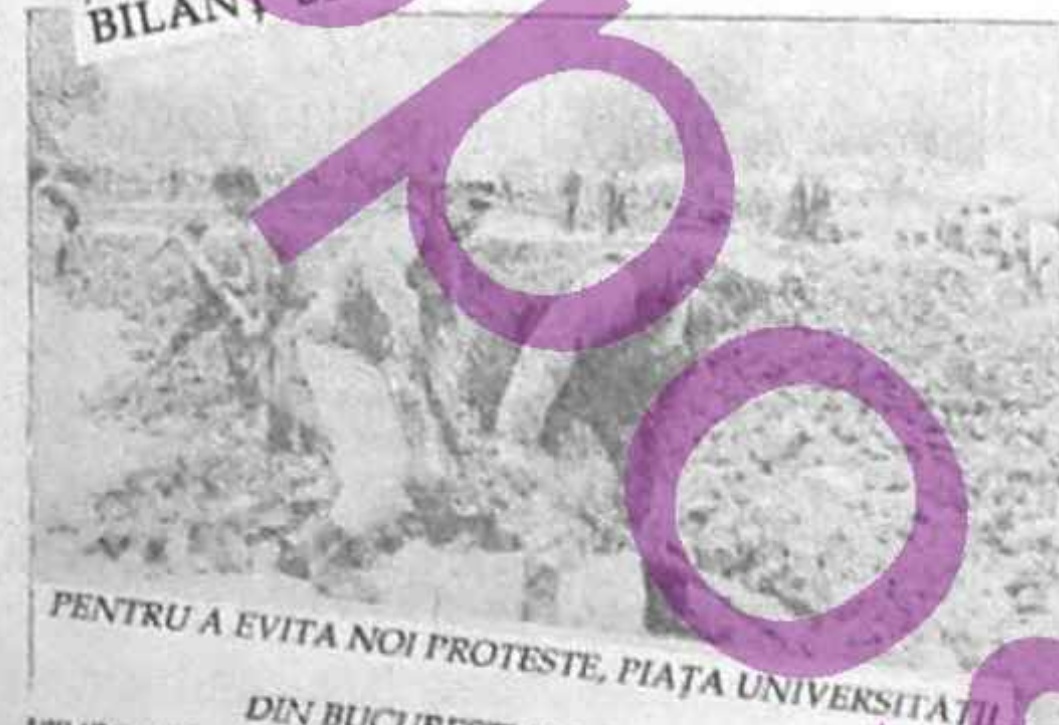
PENTRU A EVITA NOI PROTESTE, PIAȚA UNIVERSITĂȚII DIN BUCUREȘTI ESTE „SĂPATA”

Der Schock in Rumänien sitzt tief: Erst jetzt stellt sich allmählich ganze Ausmaß der Greuelthaten dar, die die randalierenden Trupps der Bergarbeiter in den letzten Tagen in Bukarest verübt haben. Die Rumänen verlassen — doch — DATORITĂ ACȚIUNILOR REGIMULUI BILANT SINGROS AL NELINIȘTILOR CELOR MAI TINERI