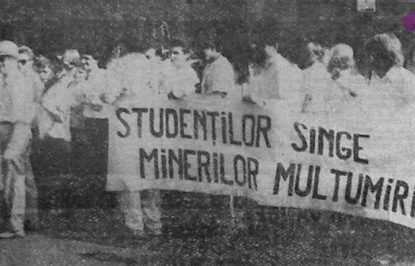
Studentii din Sibiu și-au exprimat simpatia față de marșul din Capitală

Ceea ce nu l-a împiedicat ulterior pe profesor să scrie articole care s-au dovedit foarte interesante și utile pentru cititorii săi.