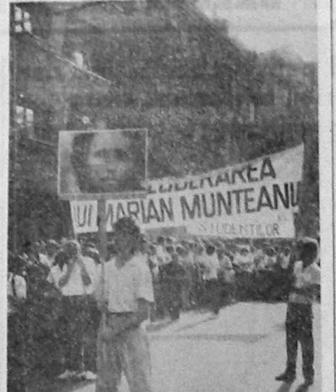
Un moment din marșul din Capitală

cu plinete. Bineînțeles că s-a tras puțin, subtil, și adevărul, suza pe turta guvernului și a formațiunilor politice conducătoare: a distins uita ce deschisă interdicția unei uita cum se dă libertate exprimării opiniei, uita ce toleranță pe capul nostru, uita ce cadru nou s-a creat.