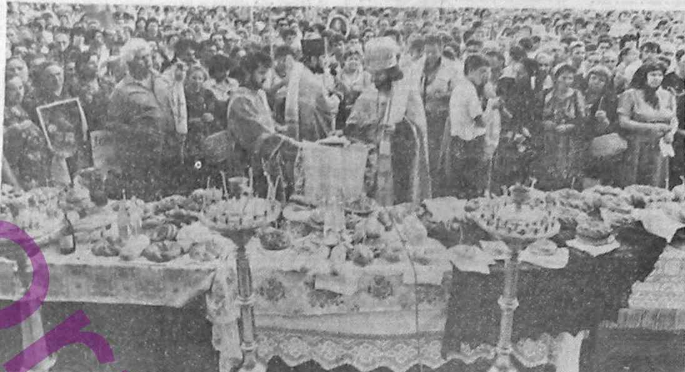
Un „TE DEUM” pentru sufletele celor ce nu mai sînt.

Datorită revoluției, politica a fost dilatăta de evenimentele, împingând-o, în direcția rindirii, afara din forță, cu consecințe grave, greu de controlat. Astfel, cantonașii în arbitraj, își pierduseră apăsarea, evoluind cu asprime, nu spre adâncime, ci spre superficialitate și deszădă.