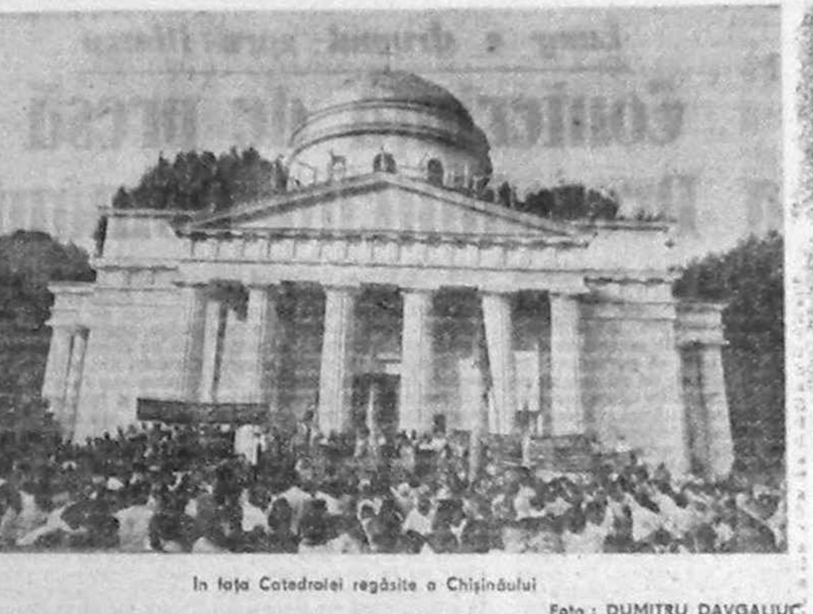
În foaia Catedralei regăsite o Chișinăului