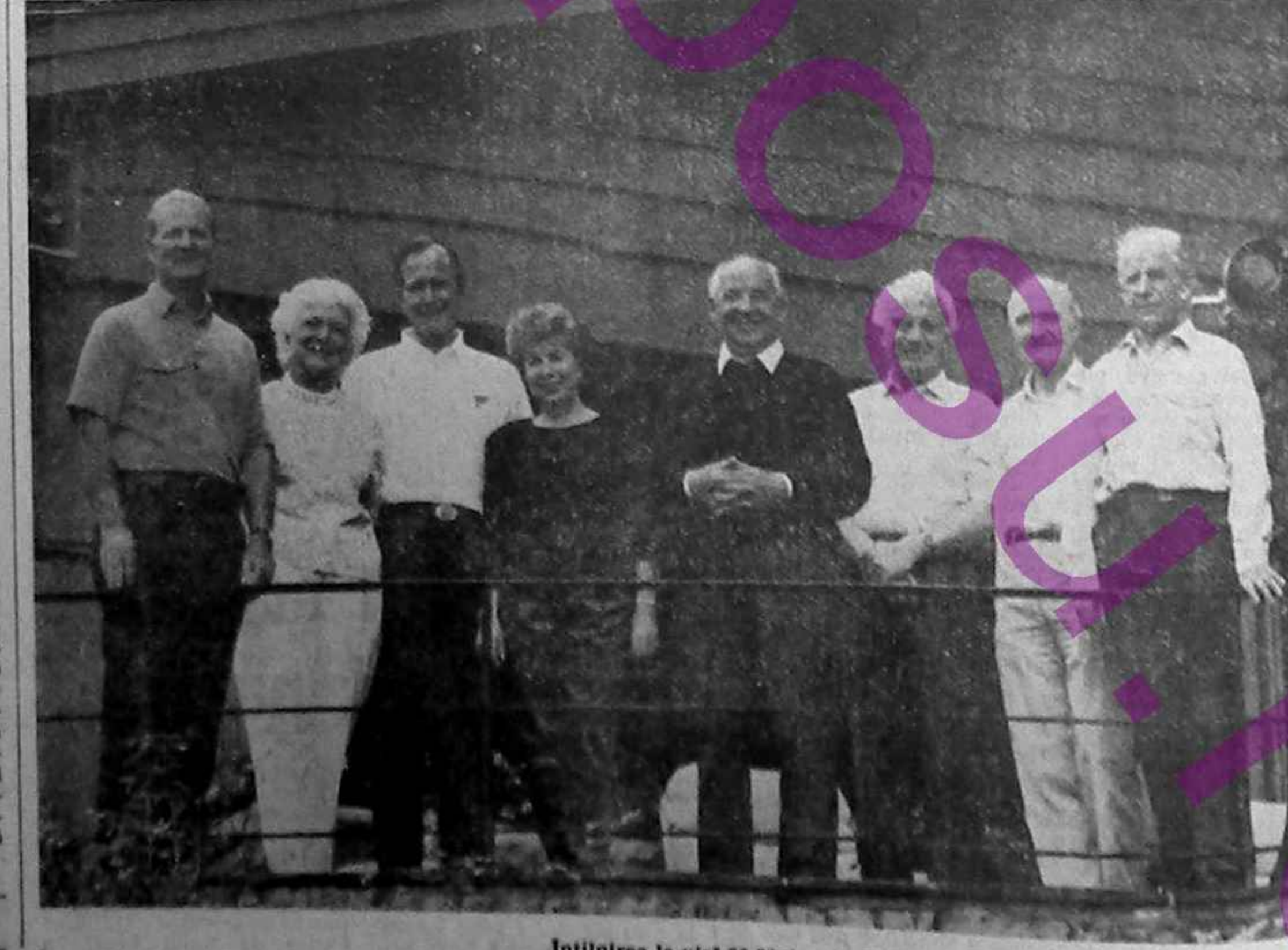
Întîlnirea la vîrf 30 Mai - 31 Iunie 1990

numai cu această condiție acceptat să facă un „accu” pentru a reduce stabilitatea pe piața petroliferă.