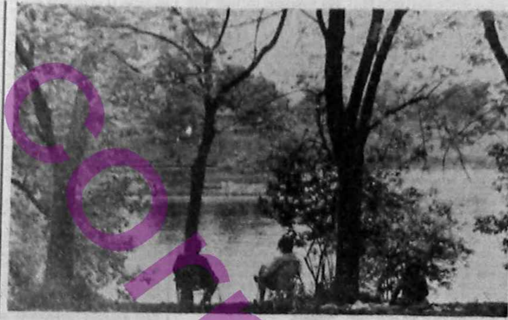
Snagov. Clipe de vișore, clipe de regăsită pace pămîntescă