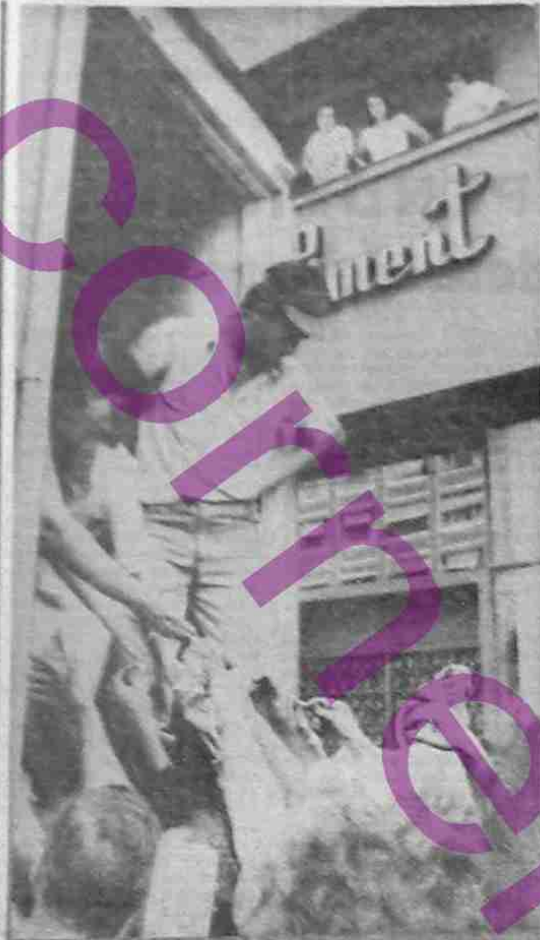
Aici se dă ceva... Din păcate, încă n-am scăpat de și nistrul și odiosul „se dă”.