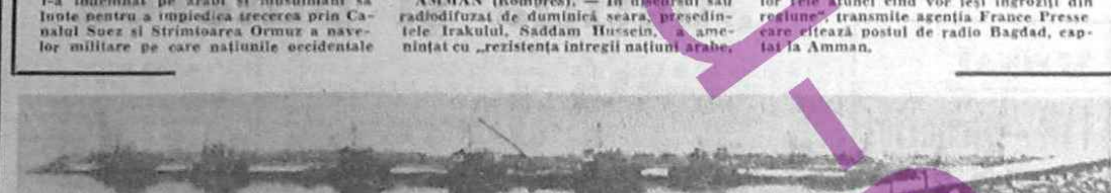
Petroliere ancorate în portul turcesc Yumurtalik, punctul terminus din Mediterană a două conducte de petrol irakiene