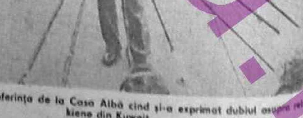
Președintele George Bush la conferința de la Casa Albă cînd și-a exprimat dubiul asupra războiului din Kuwait

Întrebări incomode De ce Saddam Hussein s-a înșelat