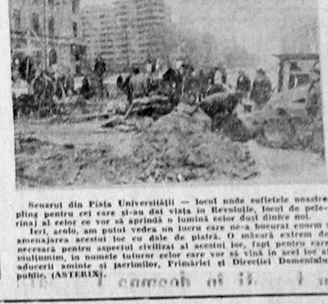
Se arata din Piața Universității... in ziua de azi...