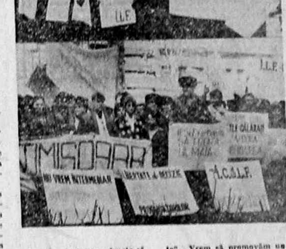
Se arata din Piața Universității... in ziua de azi...