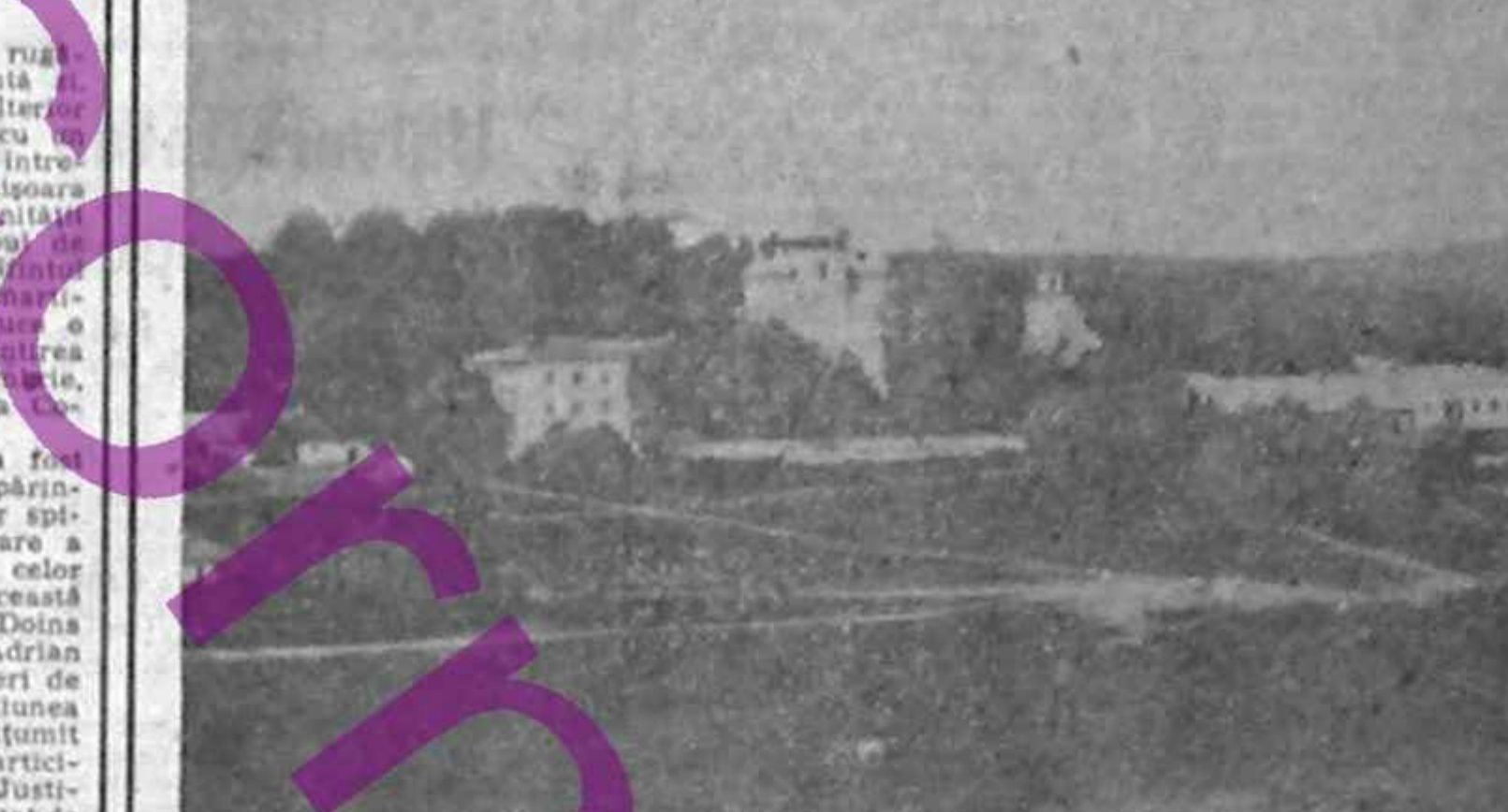
MĂNĂȘTIRI BASARABENE GÎRBOVĂȚ