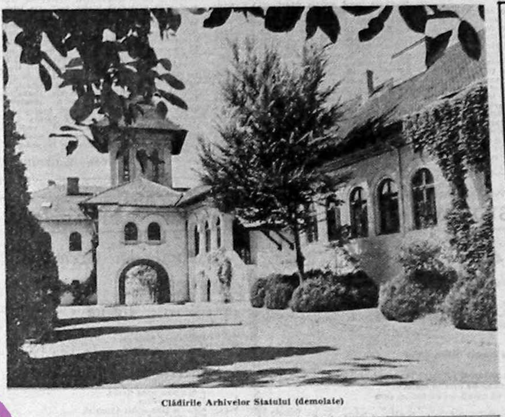
Clădirile Arhivelor Statului (demolate)