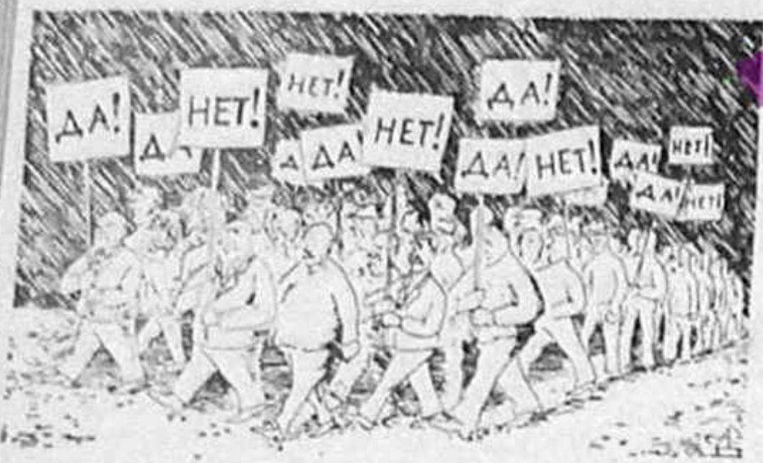
Nașterea opiniei publice „Da” sau „Nu”, important este să se exprimi într-un fel. (Literatura Gazeta)