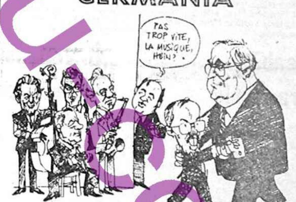
Nu așa repede, muzica, da?