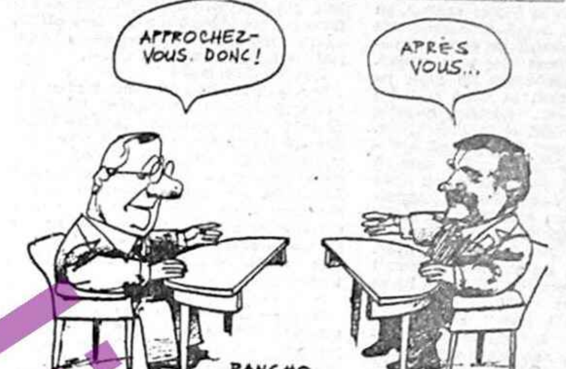
Matowiecki: Apropiati-vă, deci. Waleja: După dumneavoastră.