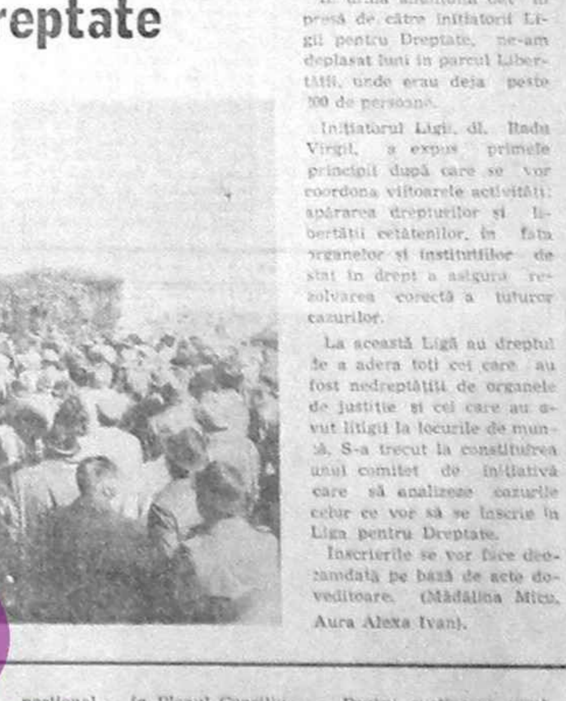
În cadrul sesiunii de lectii de democratie organizate de Liga pentru Dreptate...