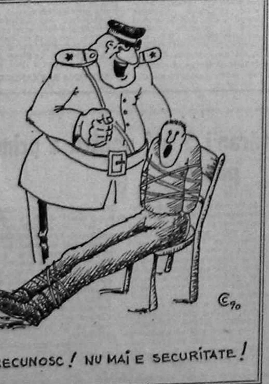
— RECUNOSC! NU MAI E SECURITATE! —