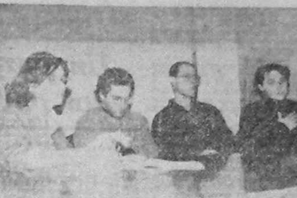
În cadrul schimburilor culturale și politice, pe 28.02.90, secțiunea de tineret a P.N.T.-c.d. a primit o delegație a Uniunii Creștin Democratice din Italia...

„Ea dimineața dimineața, Lăsați seculul de brînză, Cînd acesta menționat n-am putut decît constata: nu-i nici o brînză! Doar o „dimineață pierdută”! (SIMION DUMITRACHE)