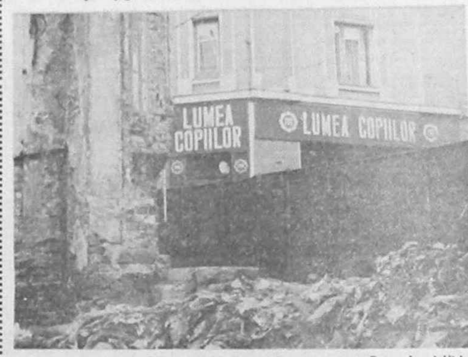
Fără comentarii