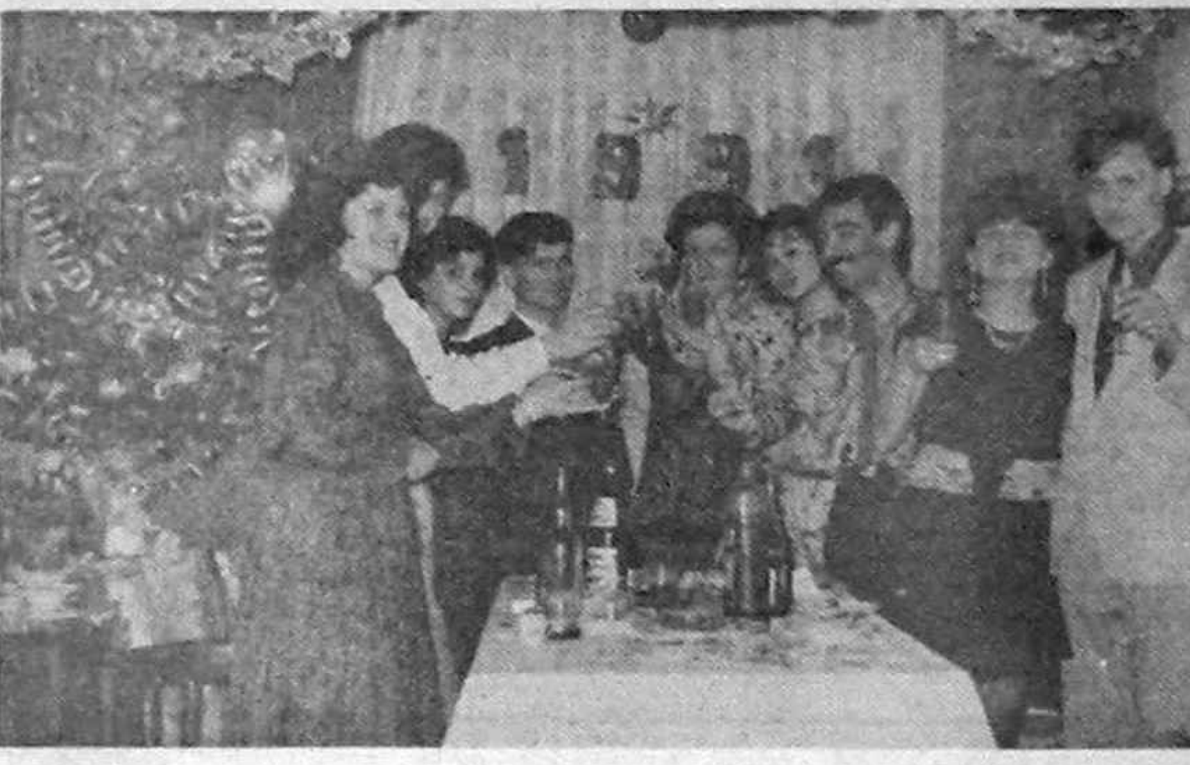
Sperăm cu toții într-un an mai bun!