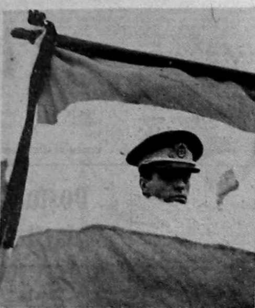
O nouă propunere de stemă?