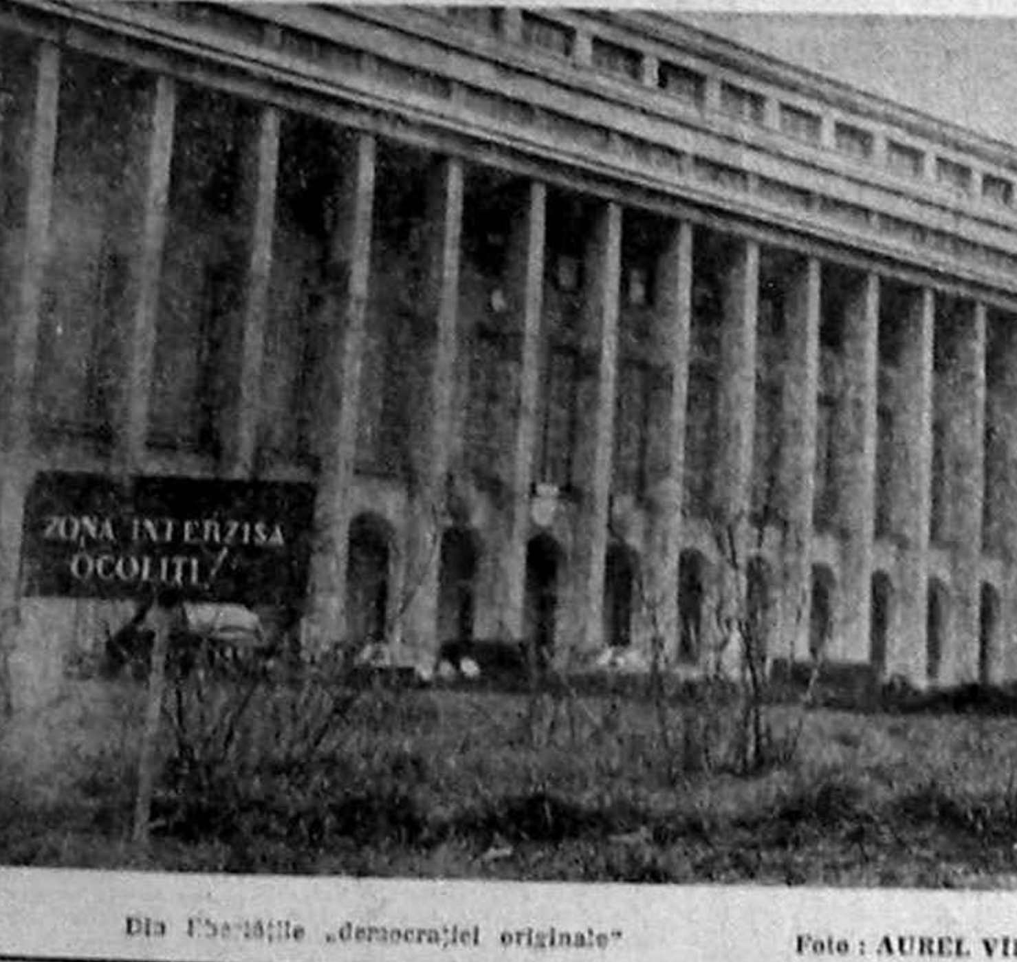
Dieta interzisă ocultat.