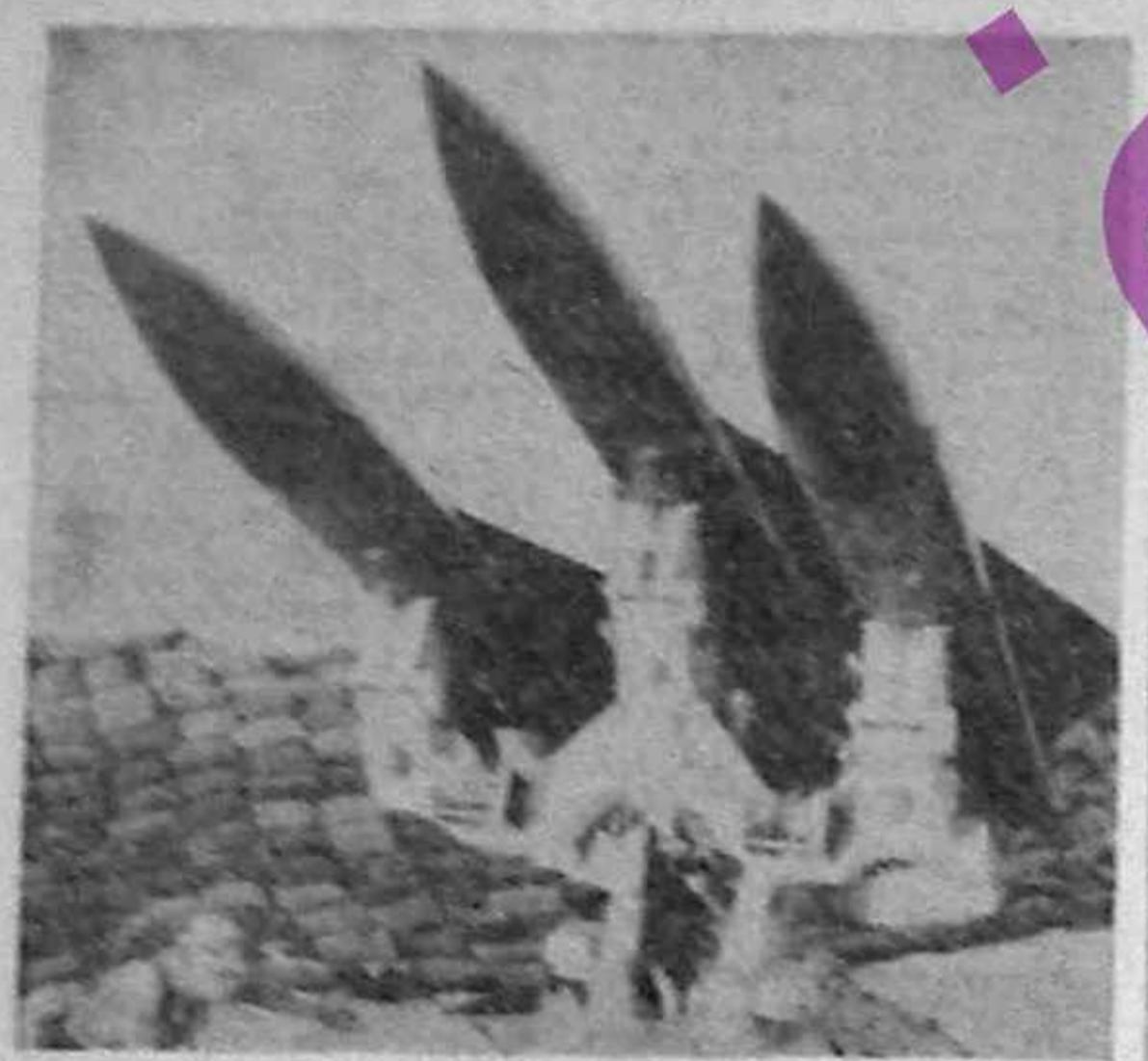
Un arsenal terifiant...

„Rachete, arme chimice, bacteriologice și nucleare. De 15 ani Irakul își îmbogățește arsenalul de arme prin colaborarea cu numeroși furnizori... RACHETE: Irakul a acumulat multe duzini de rachete tactice... ARME CHIMICE: La 40 de km de Samarra, într-o zonă izolată, irakienii au instalat principala lor uzină de arme chimice... LUPA LA SOL: Prioritatea va fi distrugerea blindatelor irakiene... ATACUL FRONTAL: La sfârșitul lui octombrie a devenit clar că Statele Unite vor trebui să iniție un atac frontal...”