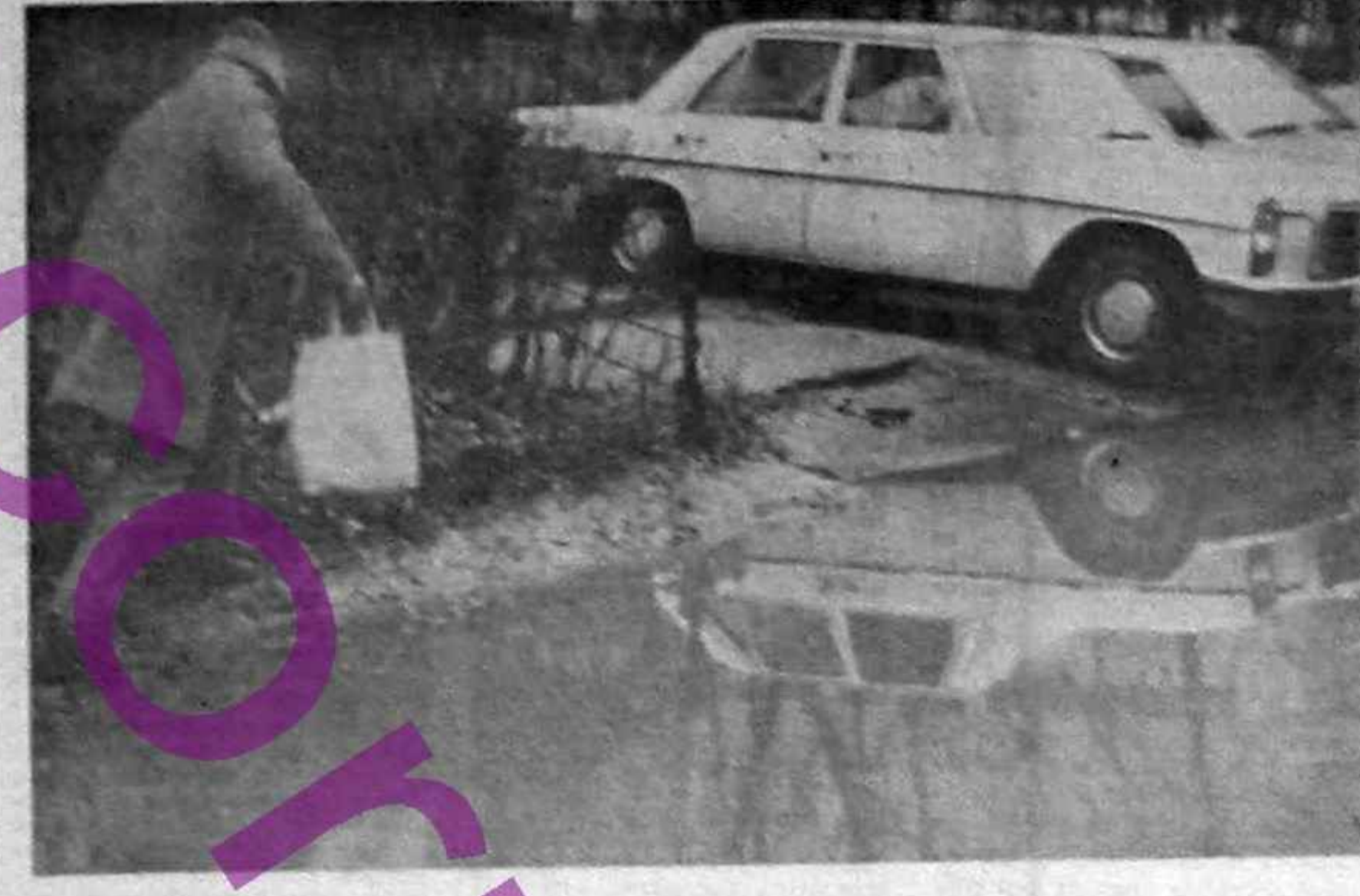
Drumul spre... Europa