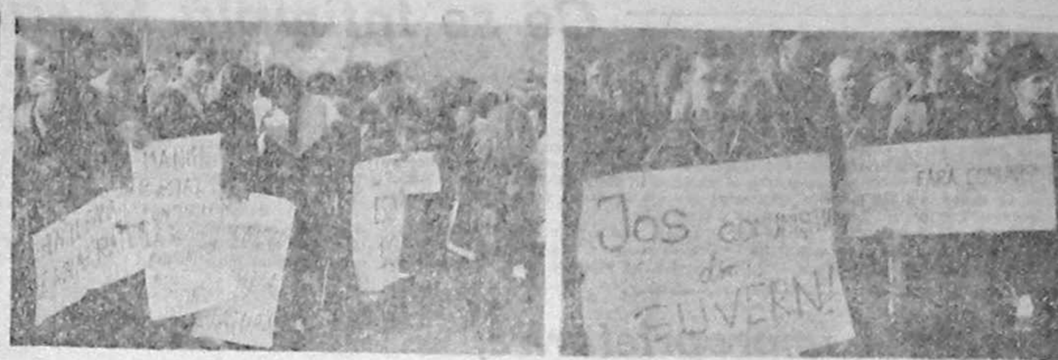
Și duminică, 11 martie 1990, viața străzii bucureștene a fost... politică. Amănunte, în ziarul nostru de mâine.