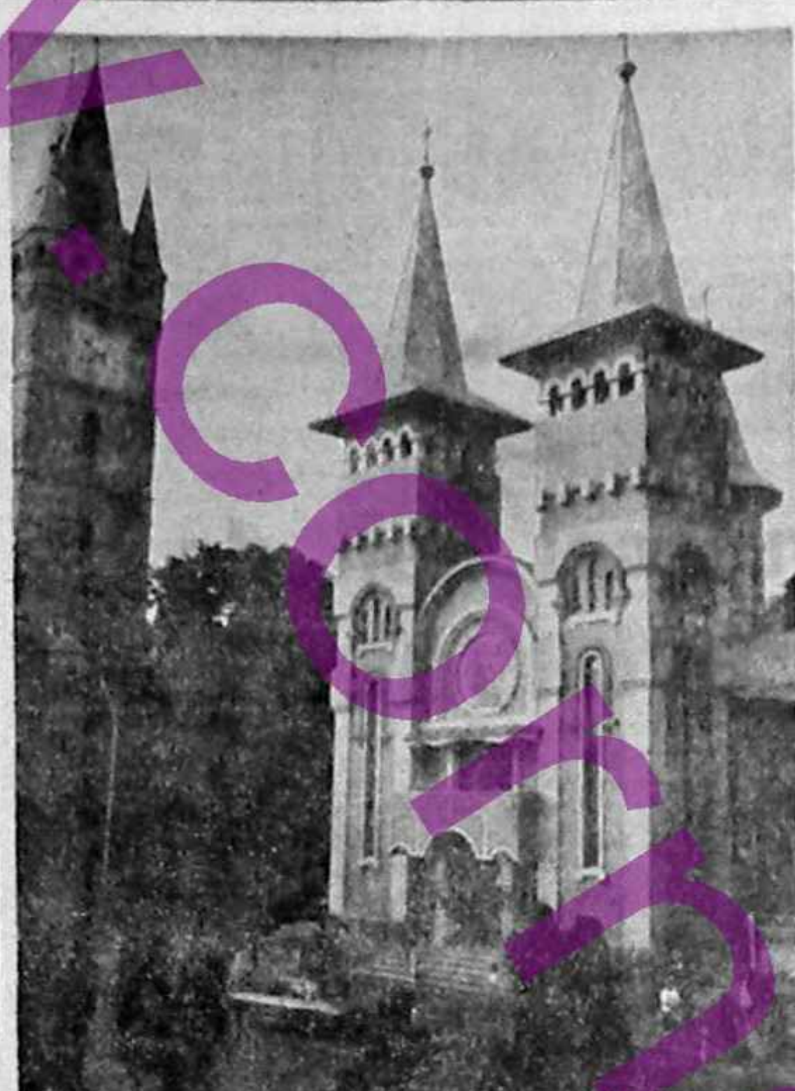
Centrul Vechi din Bala Mare