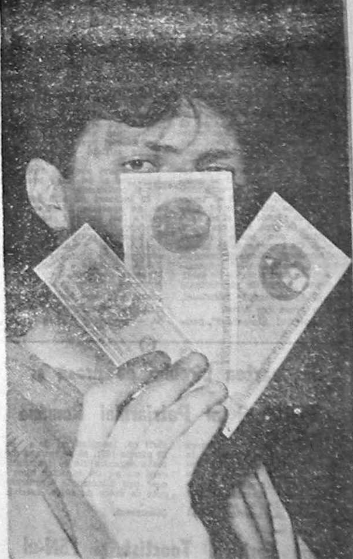
Correspondentul celor 200 lei

Am vîrstă de 36 de ani, sînt angajat la IREMOAS — București, în funcția de controlor C.T.C. și am o vechime de 18 ani în acest post.