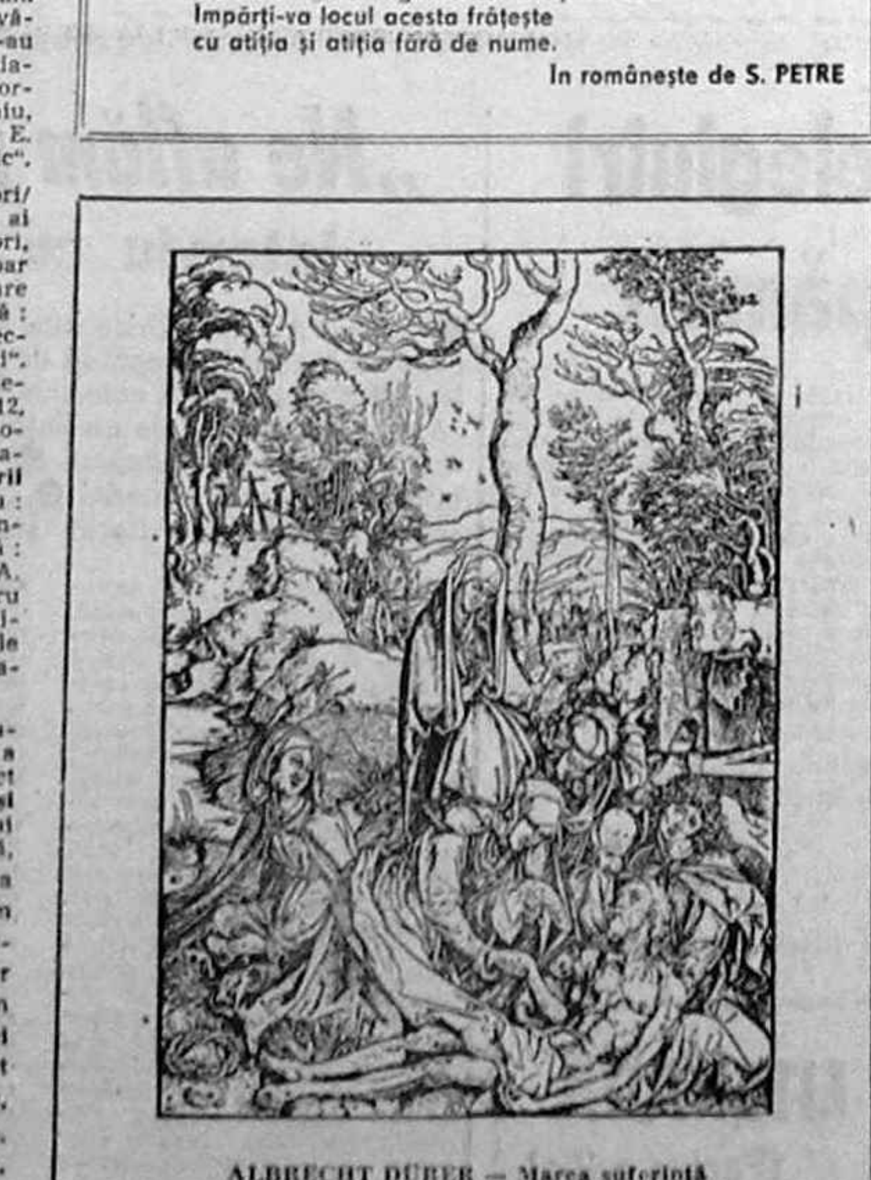
ALBRECHT DÜRER — Marea suferință