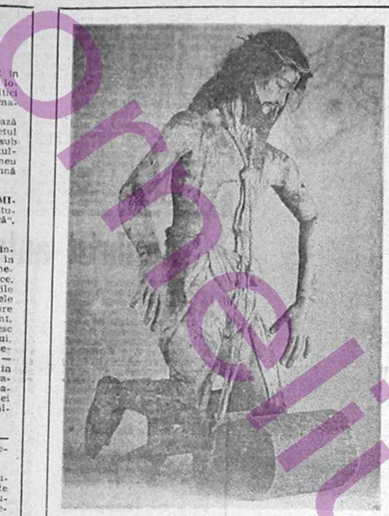
Isus Cristos în viziune mexicană

Un lung și admirabil eseu despre actuala condiție a intelectualului român semnează în Amiteatrul (nr. 3, 1991), dl. Sorin Dumitrescu. Din pateticele sale constatări reiese că: „Cum e îngădat cu intelectualii cei mai de seamă, glorificați pînă mai ieri de populația țării, scăpați ca prin minune din strînsărea ucigașă a reprezentanților comuniste, să fie calomniați de aceiași mizeri tocmii, care l-au bălăcoșit pe tot întinsul epocii de aur?” Poate unde auzul acestei epoci picură mai departe în pungile ticăloșilor, strecurat printre degetele stîm noi cui... ■ De Alexandru George și Ion C. Brătianu scria de temelnic studiul privitor la viața noastră politică din trecut, la ceea ce erau dreapta și stînga. Titlul recentului eseu: „Extremele nu se mai disting” (România literară, nr. 13, 28 martie a.c.) este edificator. Criticul analizează poziția critică față de democrația a tinerei, pe atunci, Mirena Eliade, Petre Pandrea, E.M. Ciocoran. Pe atunci, adică la începuturile deceniului al patrulea, Despre realitățile politice din România acelei perioade: „Democrația română, cu toate imperfecțiunile ei, făcea un fru-