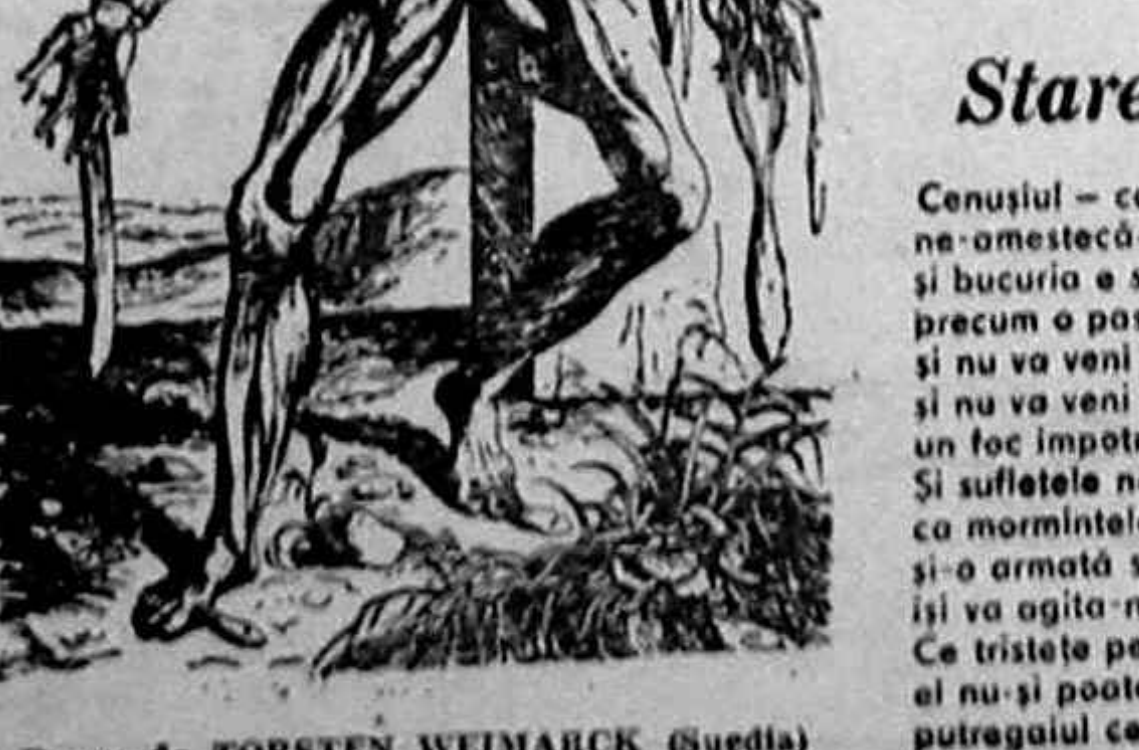
Desen de TORSTEN WEIMARCK (Suedia)