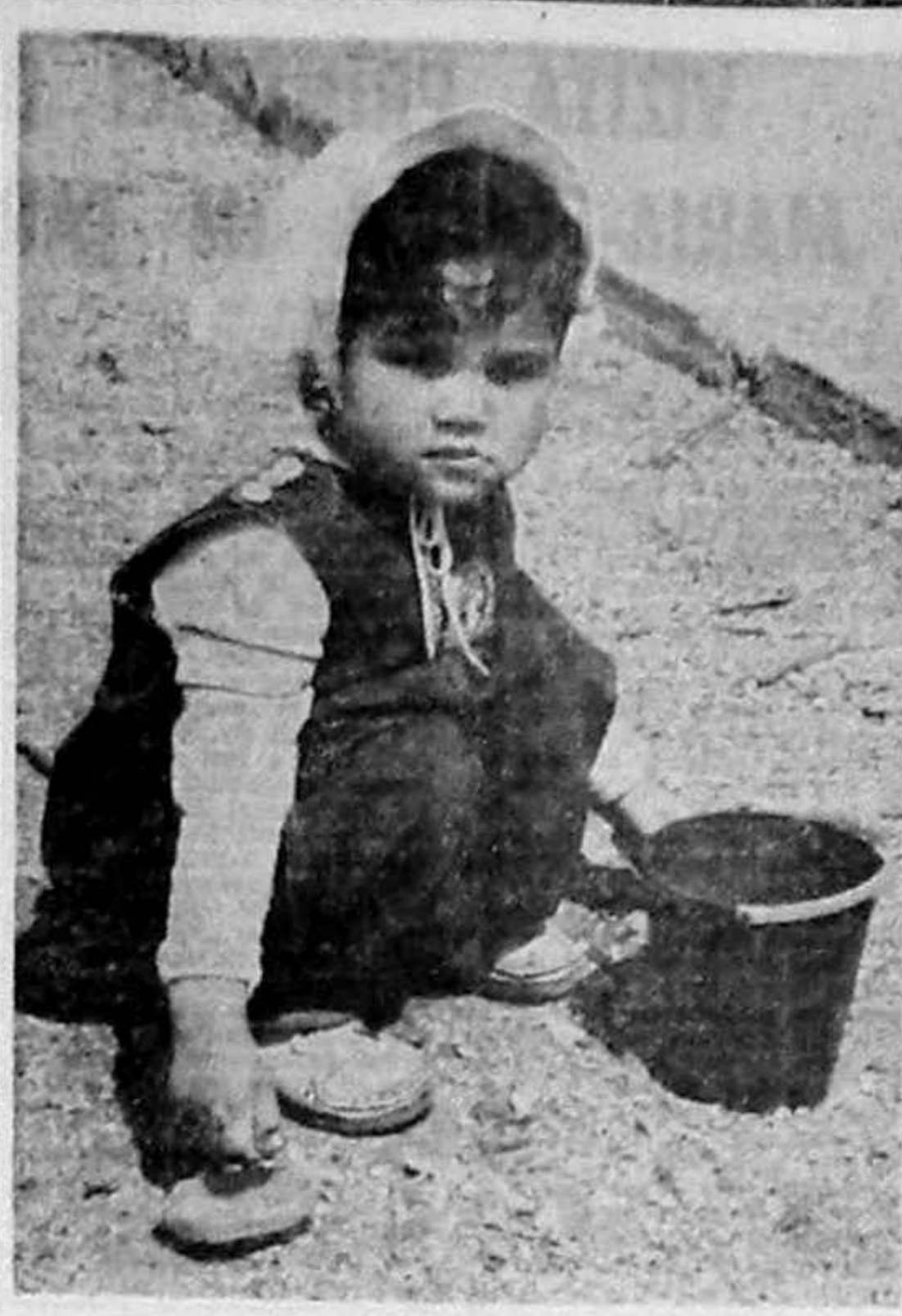
Un fluture descindind cu aripile de rouă suferința părinților!

...sultare a pieții și de un timp de analiză mai îndelungat; ceea ce vom avea - presă, de făcut. ● pentru informarea operativă și exactă a tuturor agenților economici din țară sau din străinătate, centre de comerț și turism în fiecare județ. ● în ce privește turismul care aduce ca aport valutar doar 3,1% din PIB, dar care are o pondere din punct de vedere al activității economice, este foarte scăzut. ● în ceea ce privește comerțul și turismul în țară, este în discuție problema de a se crea un centru de comerț și turism în fiecare județ. ● în ceea ce privește turismul care aduce ca aport valutar doar 3,1% din PIB, dar care are o pondere din punct de vedere al activității economice, este foarte scăzut. ● în ceea ce privește comerțul și turismul în țară, este în discuție problema de a se crea un centru de comerț și turism în fiecare județ.