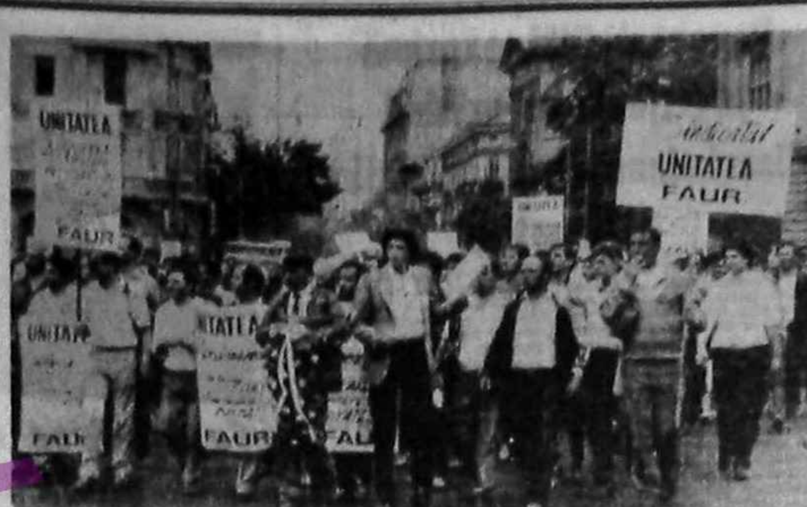
Oare s-au trezit muncitorii? Imaginea celor încolonați de la „FAUR” ne dă speranță!

... în sezon de înflorire, nu se pot recolta în cantități mari, ceea ce determină în mod direct pierderi în valoarea produselor agricole. În condițiile actuale, producătorii agricoli nu au posibilitatea de a-și vinde produsele în condiții normale, ceea ce determină pierderi în valoarea produselor agricole. În condițiile actuale, producătorii agricoli nu au posibilitatea de a-și vinde produsele în condiții normale, ceea ce determină pierderi în valoarea produselor agricole. Am intrat în mai multe țări din Europa și am văzut că în țările dezvoltate, producătorii agricoli au posibilitatea de a-și vinde produsele în condiții normale, ceea ce determină pierderi în valoarea produselor agricole. În condițiile actuale, producătorii agricoli nu au posibilitatea de a-și vinde produsele în condiții normale, ceea ce determină pierderi în valoarea produselor agricole.