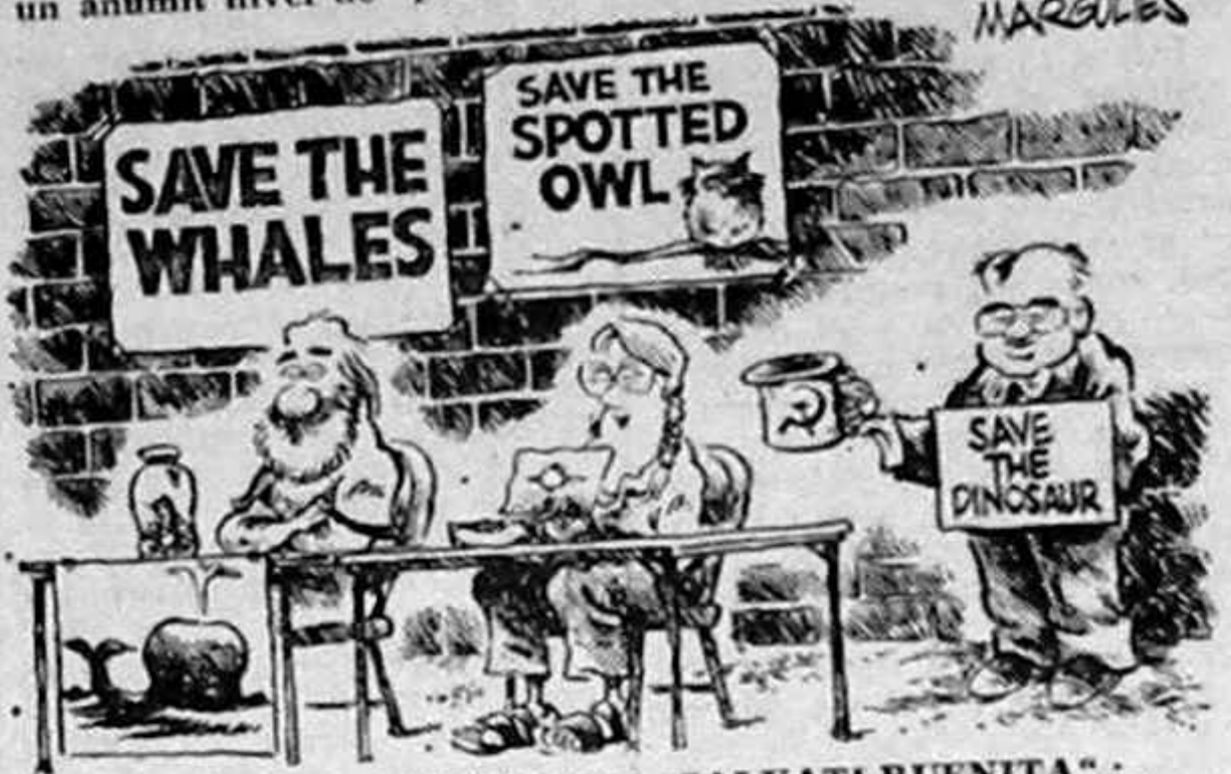
„SALVAȚI BALENELE”; „SALVAȚI BUFINȚA”; GORBACIOV; „SALVAȚI DINOSAURUL”