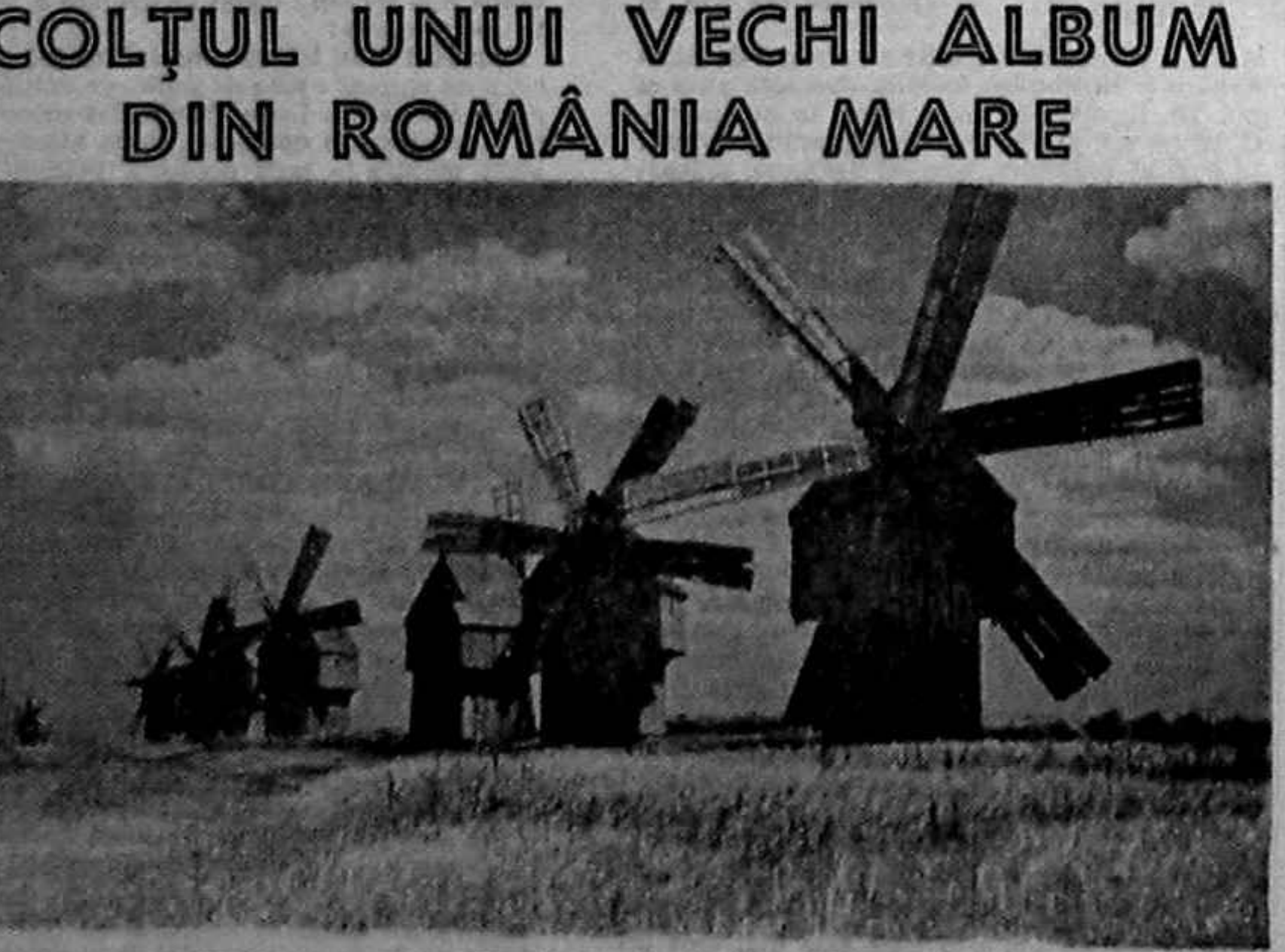
1932 — Mori de vînt în Basarabia