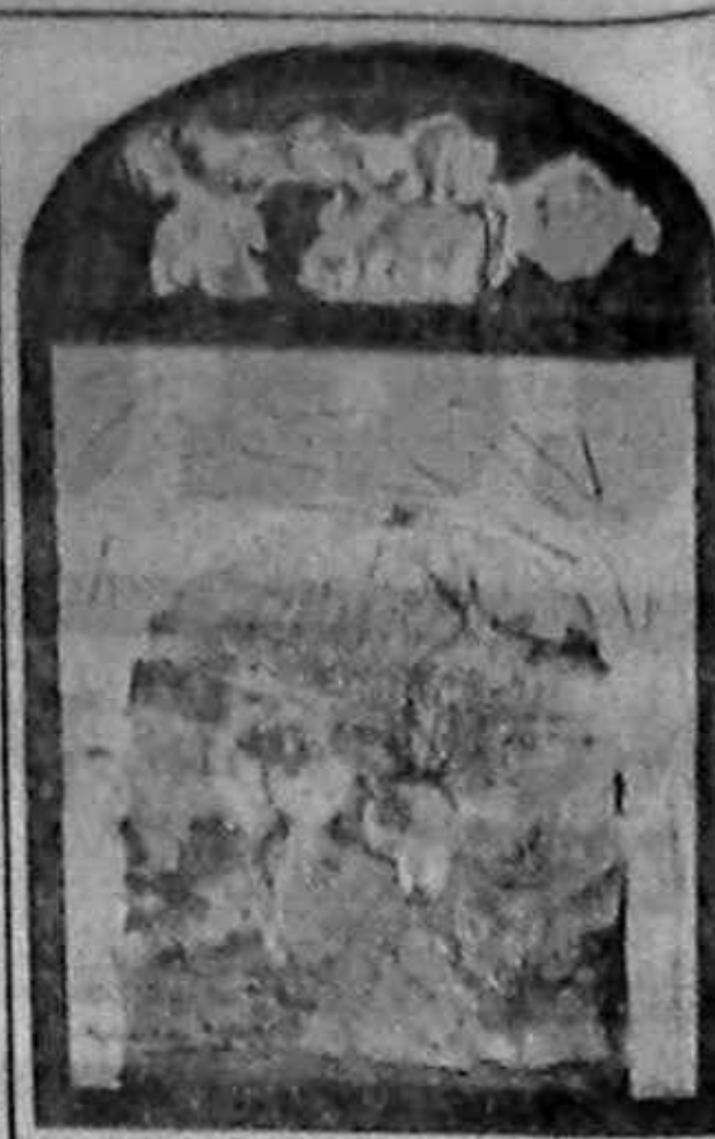
CUCERZAN HOREA . painting .