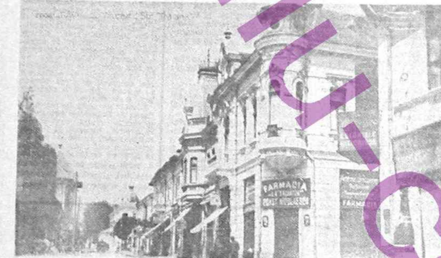
AȘA CUM A FOST ZONA COMERCIALĂ, AZI DEMOLATĂ