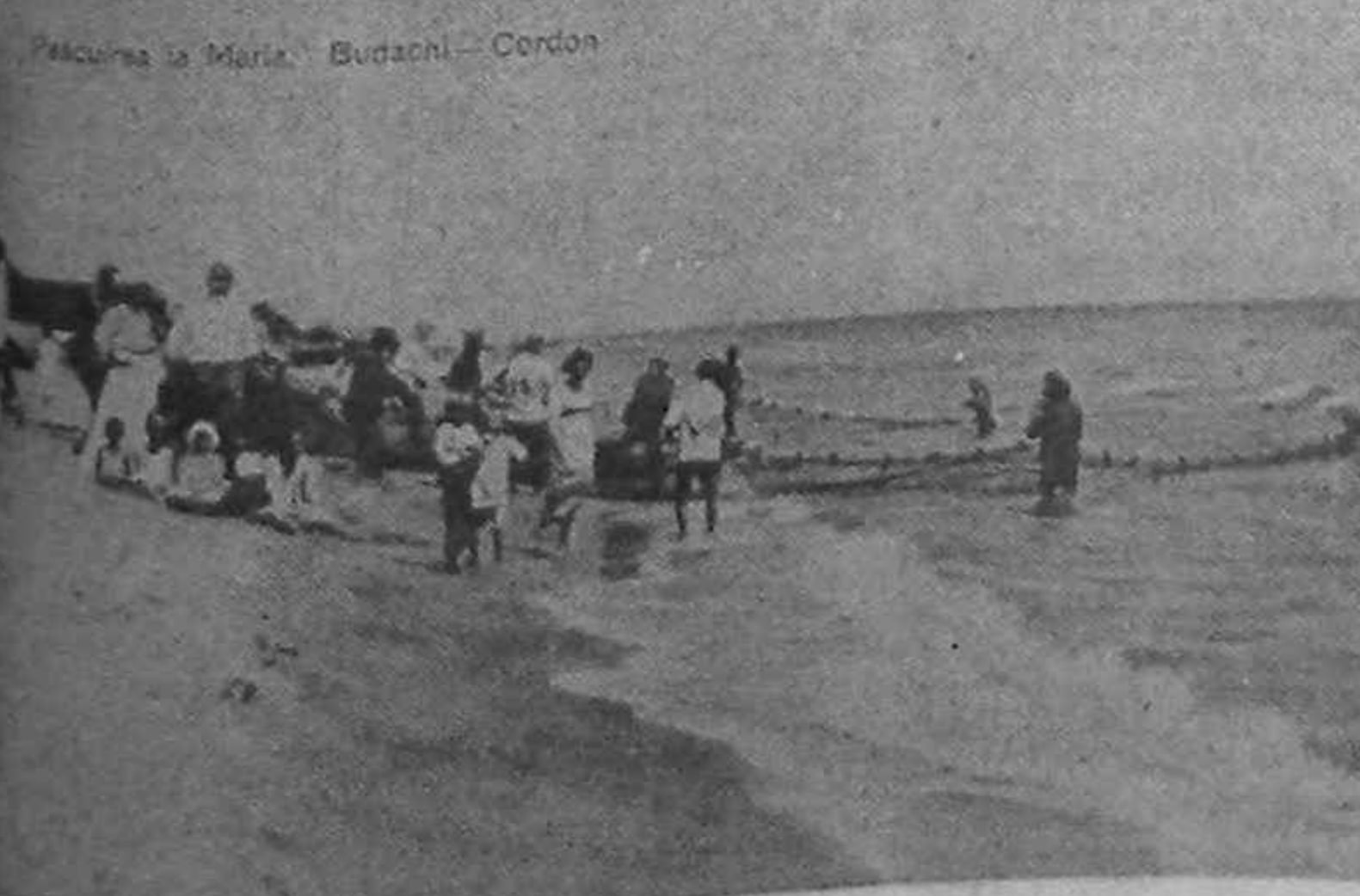
BUDACHI-CORDON-Pescari la mare (1930)