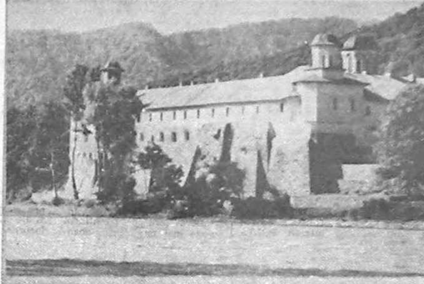
MANĂȘTIREA COZIA (MONUMENT ISTORIC, SEC. XIV)

Lumini și umbre în județul Vilcea (pagina a 3-a)