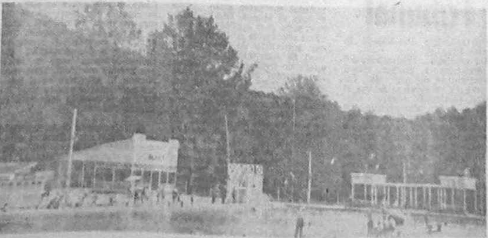
AȘA CUM A FOST STRANDUL