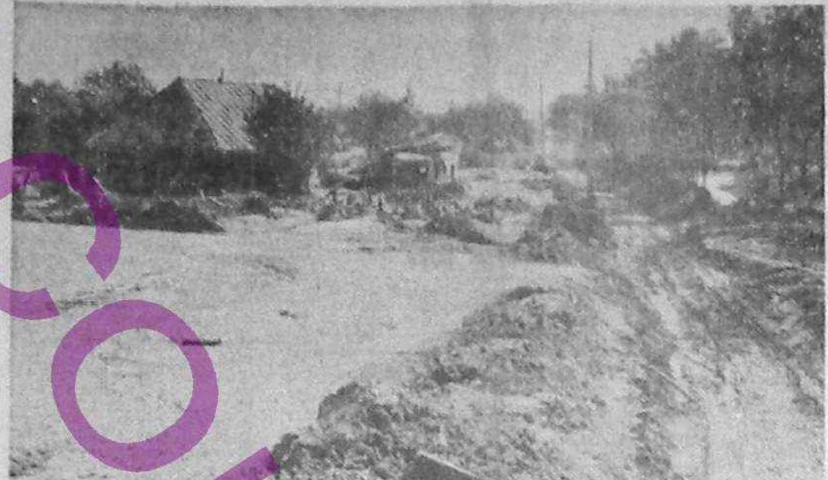
RĂCĂCIUNI și ce a mai rămas în urma furiei apelor