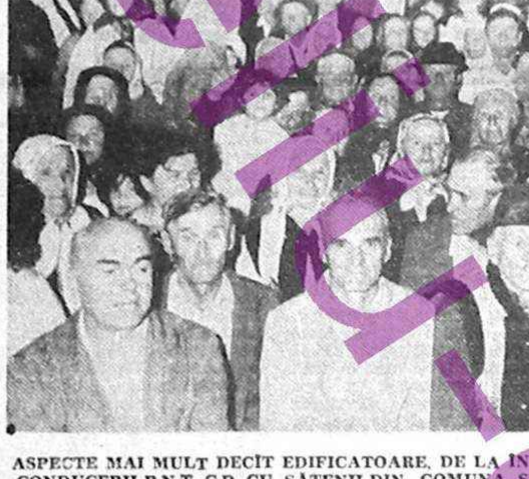
ASPECTE MAI MULT DECIT EDIFICATOARE, DE LA INTILNIREA AVUTA DE MEMBRI AI CONducerii P.N.T.-C.D. CU SĂTENII DIN COMUNA STRAJA, JUDEȚUL SUCEAVA