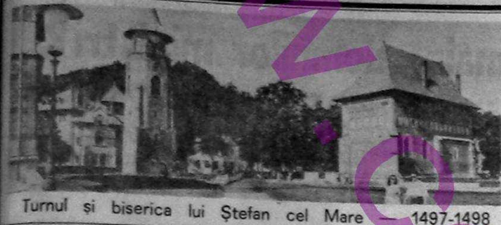
Turnul și biserica lui Ștefan cel Mare — 1497-1498