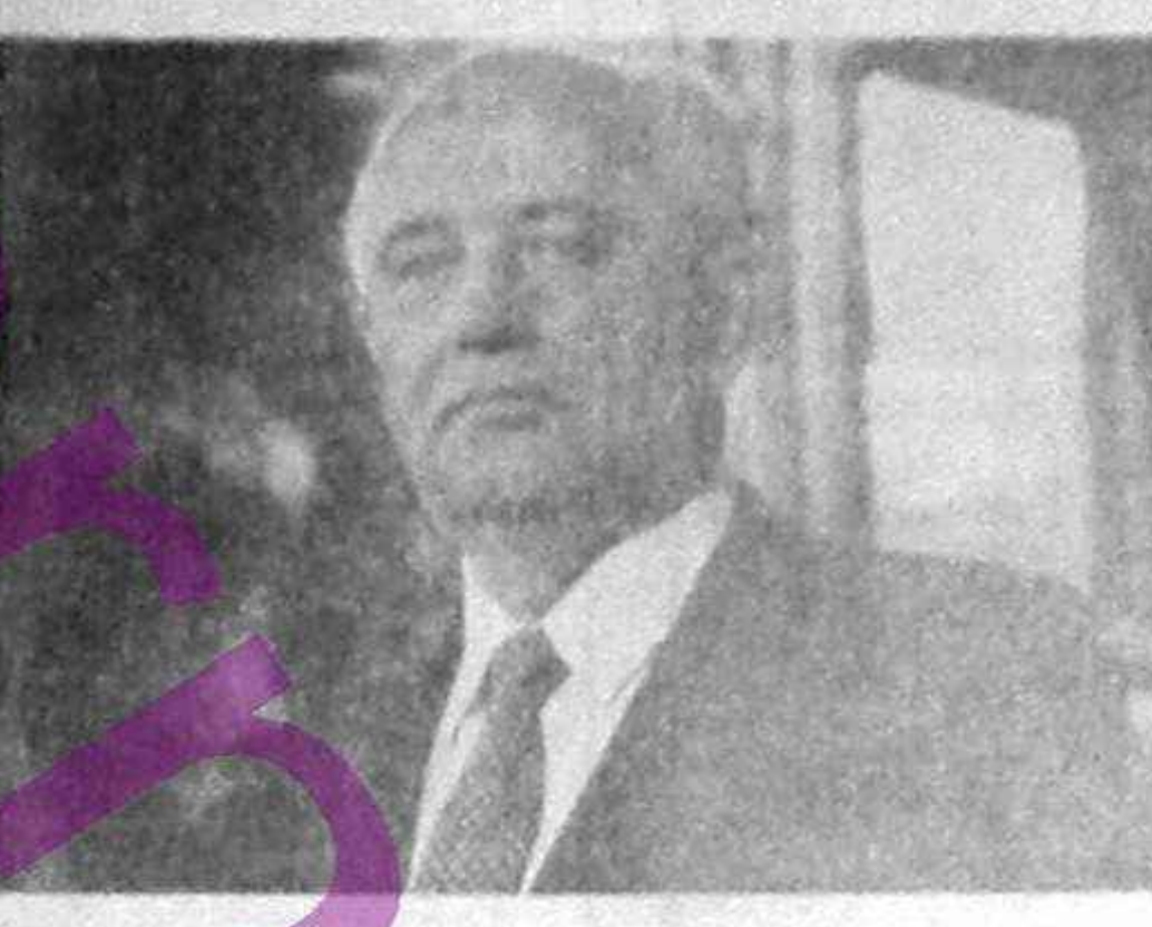
CORNELIU COPOS Președintele Partidului Național Țărănesc Creștin și Democrat