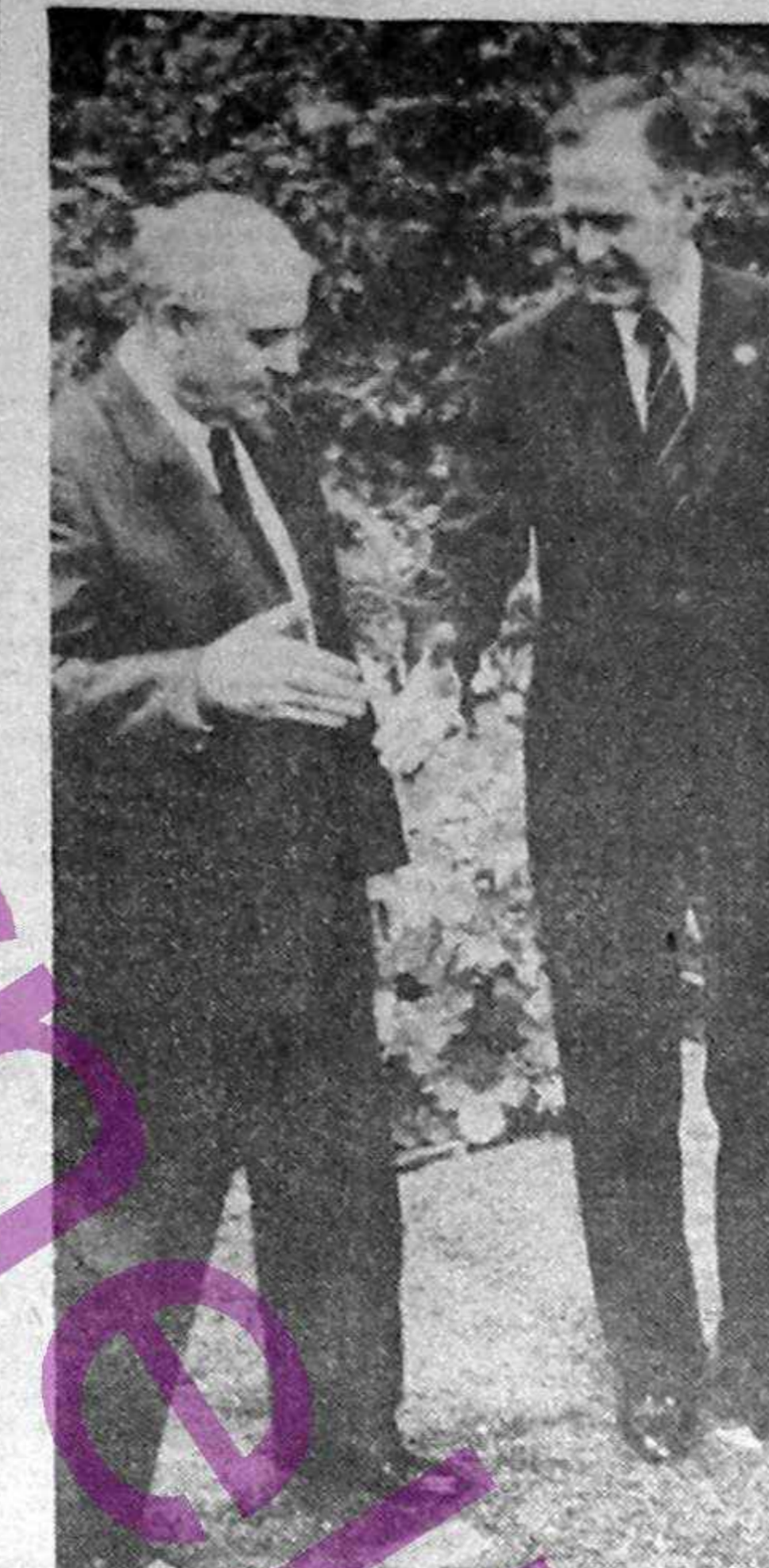
1986: Primele reforme, primele greșeli