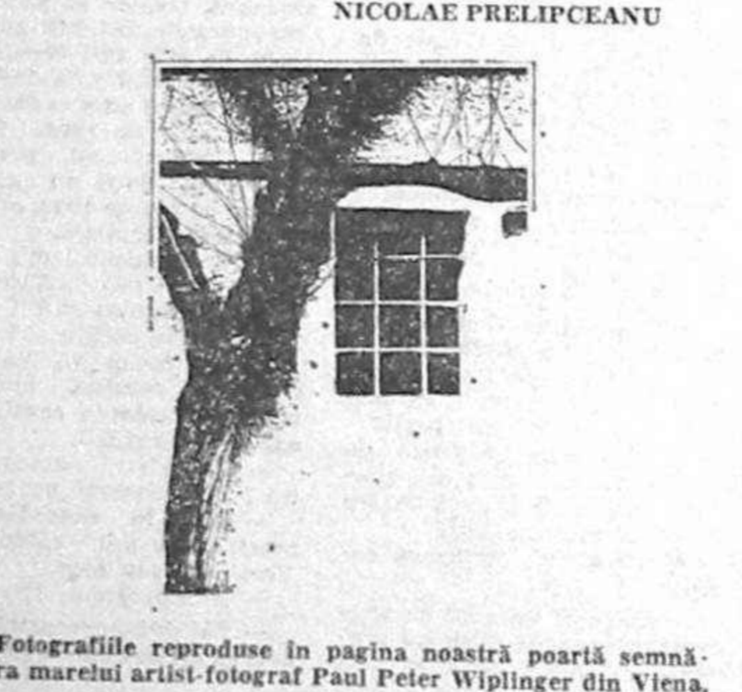
Fotografiile reproduse în pagina noastră poartă semnătura...