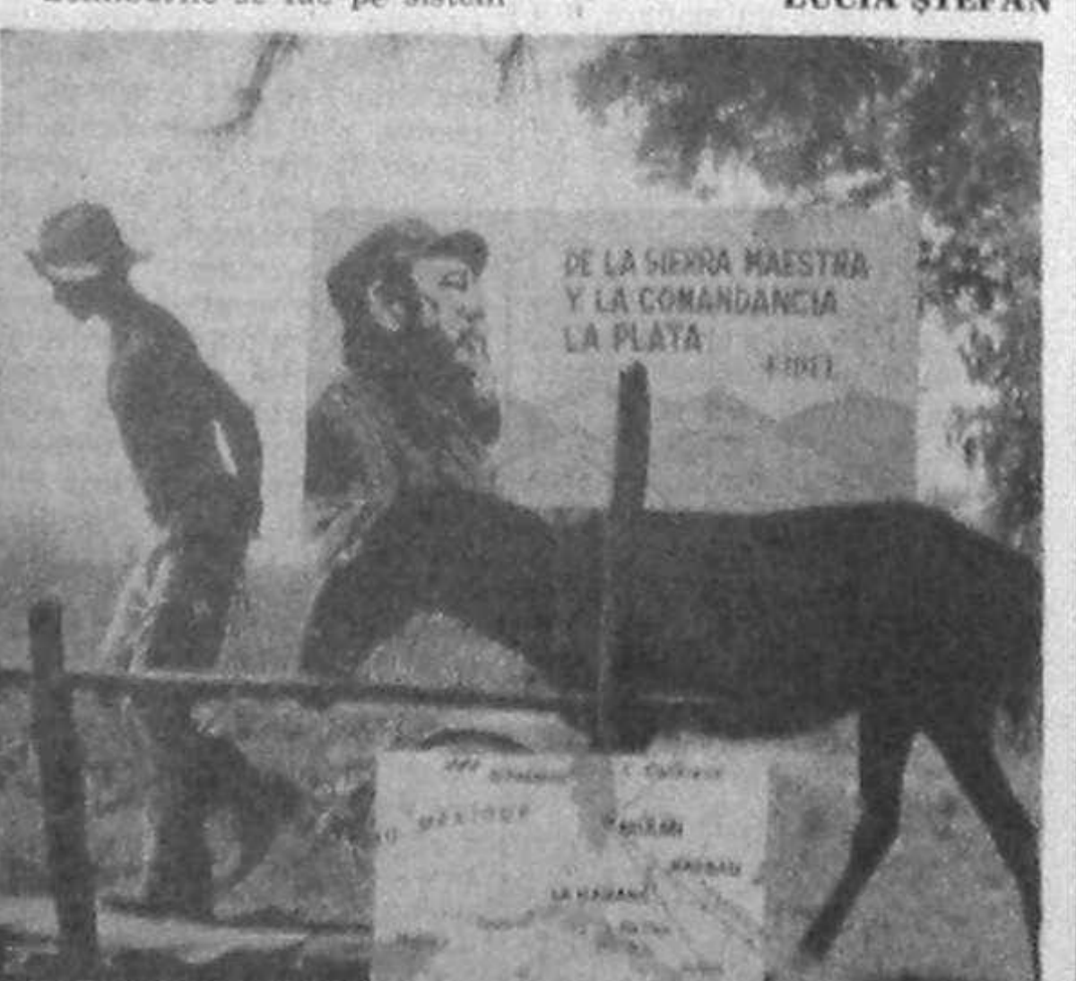
DE LA SIERRA MAESTRA Y LA COMANDANCIA LA PLATA