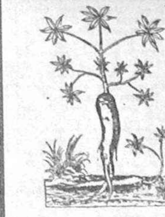
Gravuri din „Jurnal Brazilian” (1577) de Jean de La „Două călătorii în Brazilia” (1548-1555) de Hans Sl

în somn visa că el este fratele cel mare, iar fratele cel mic este fratele cel mic. Iar fratele cel mare poate să facă tot ce vrea pentru că el este stăpîn după lege, chiar și să priceapă ce stă scris acolo. În piatra din zidul odăii de dormit. Noaptea l-a scos din groapa de lut. Nu era mort. L-a dus în pînții, sub cotețul porcelor. Acolo nu intră nimeni din ținea duhoșii. Dacă voiau să fure, furau din — alia parte. L-a închis cu zăbrele și după două săptămîni a dat veste că pe fratele cel mare l-au țără țării înalte de a ajunge la Tichilești. În locul lui a îngropa, o jumătate de porc și l-a pufnit risul cînd popa făcea slujba. Era ferecit că el este acum stăpîn și nici n-ar fi trebuit să fie ucis de frate. La două zile cobora să-l dea mîncare și apă de băut. L-a fost frică înții că fratele o să moară. N-a murit, cîme moare de o lovitură de par în frunte ? Dacă ar fi fost în m_ățele capului, da, ar fi murit, dar nu era el omul ca-