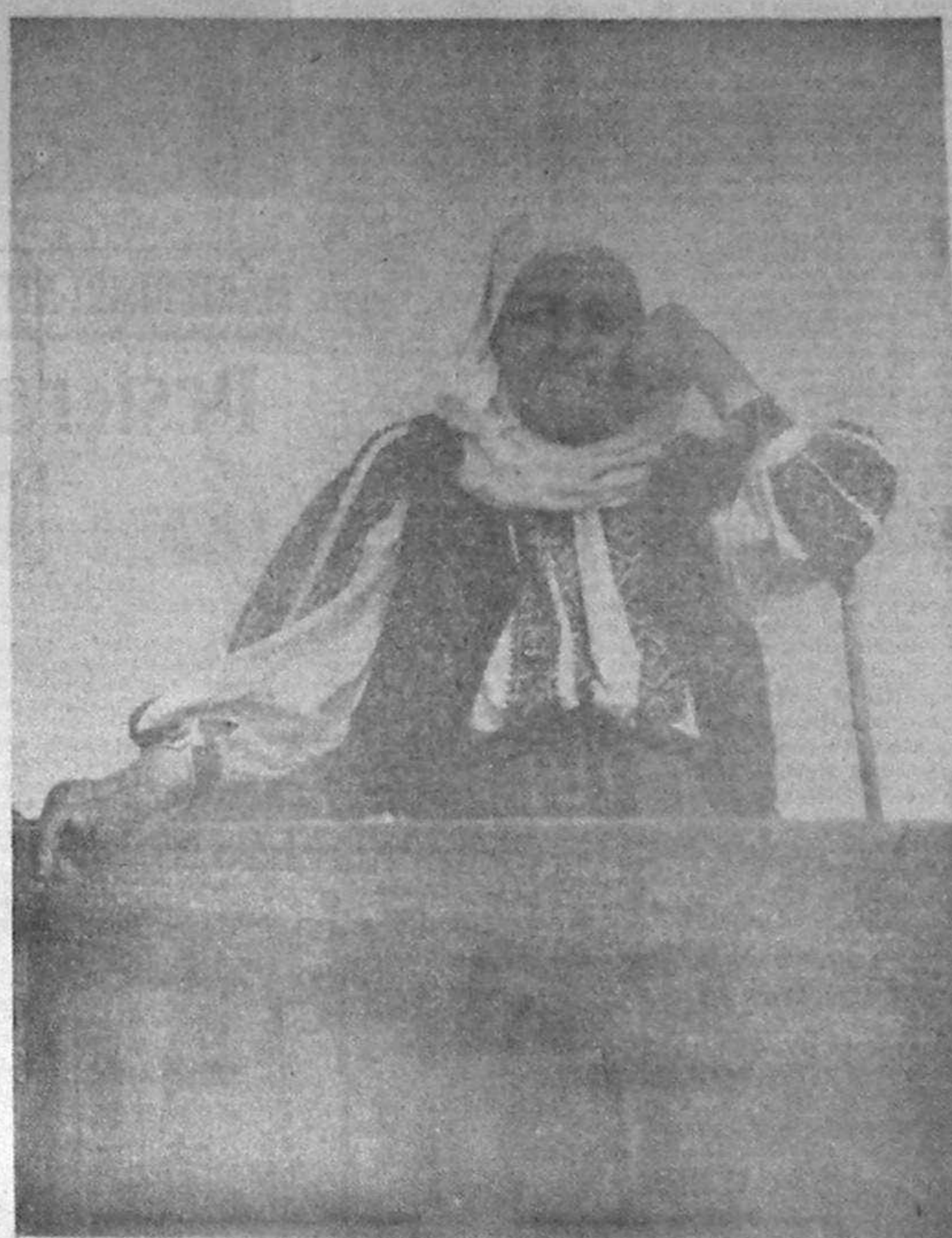
Înapoi la colectivizare?

Există puține șanse, au apreciat participanții la discuții, ca recenta campanie a domnului Stoiljan împotriva corupției și speculei să dea rezultate dorite. Același lucru se poate spune și despre încercările guvernului de a păstra un raport rezonabil între prețuri și salarii.