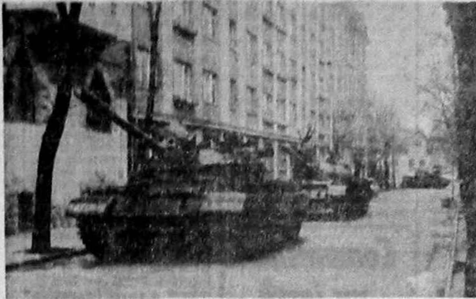
C.J.P.U.N. Tg. Mureş pînă de tancuri