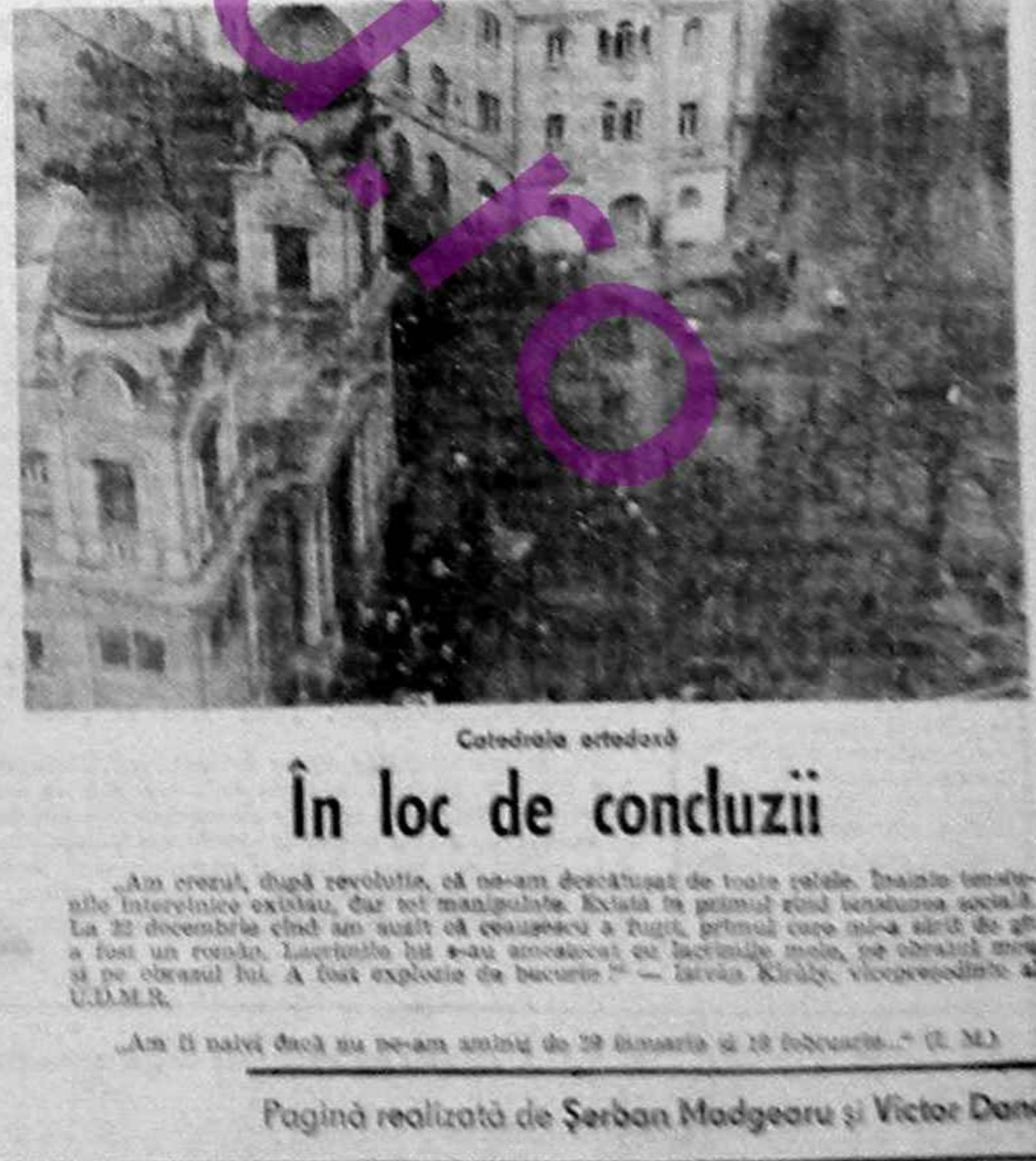
Catedrala ortodoxă. În loc de concluzii. 'Am crezut, după revoluție, că ne-am descolțat de toate rețelele...