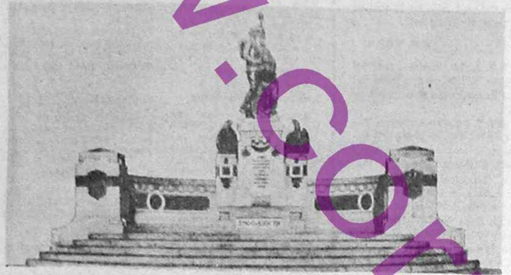
Monumentul Unirii, dervelit la 11 noiembrie 1924 la Cernăuți