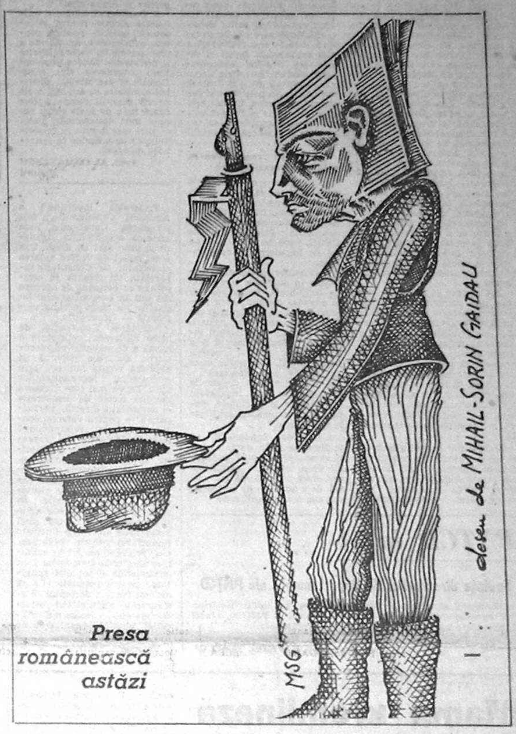
Presă românească astăzi