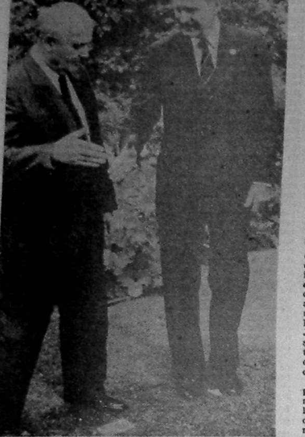
Cei dol, înaltele de independența Ucrainei