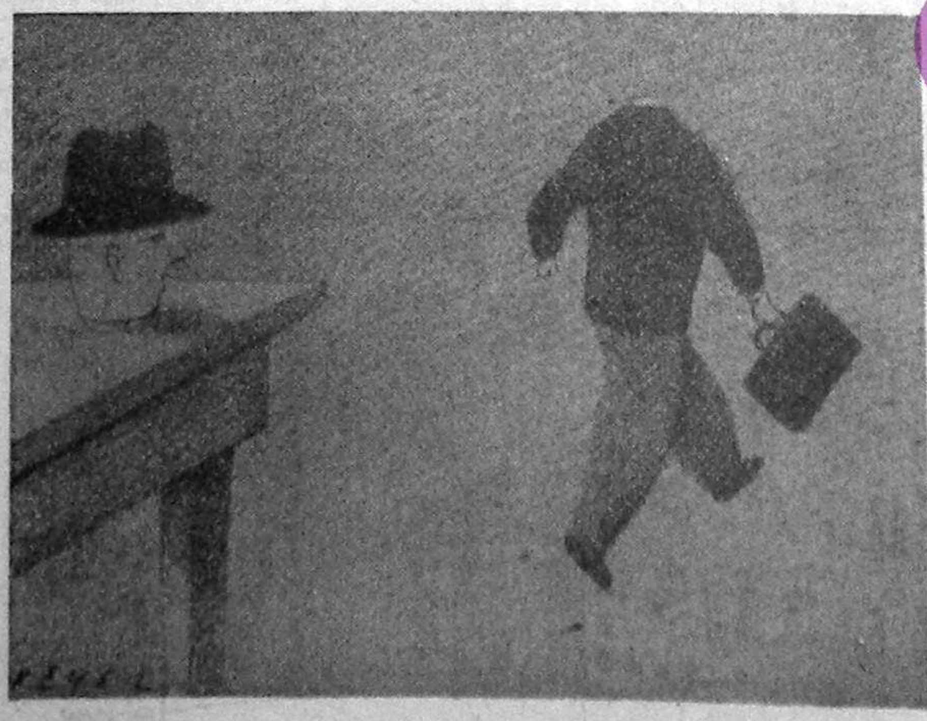
„Iugoslavia” (După Der Standard)

rie de probleme de politică internă și externă — a declarat ministrul ucrainean de externe, Anatolii Zlenko.