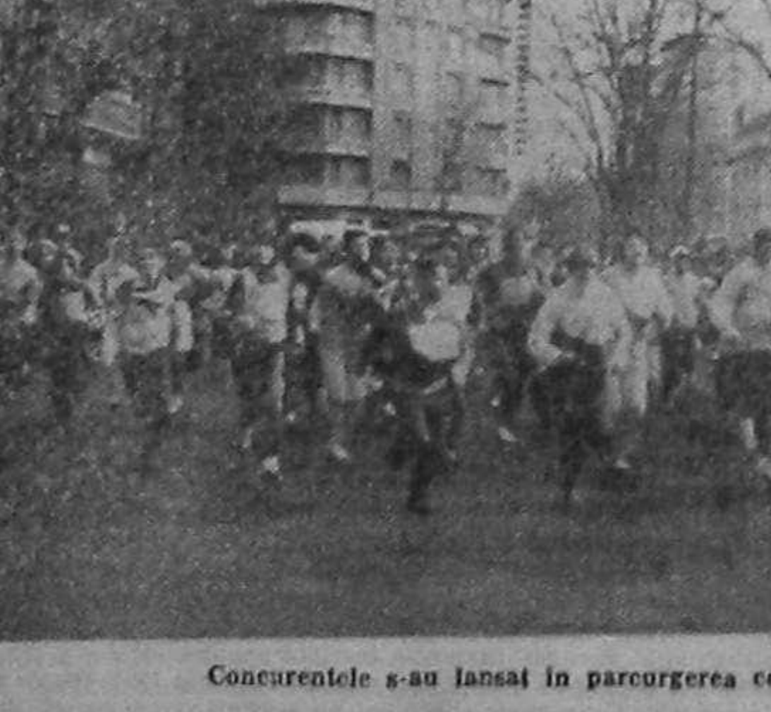
Concurențele s-au lansat în parcurgerea celor 3.800 m.

Ele nu vor participa decît la un campionat care să fie recunoscut de forțele internaționale. În partida victorioasă cu Cagliari (4-1), atacantul olandez de la A.C. Milan, Marco Van Basten, a realizat un nou hat-trick și al cincilea de cînd activează în Italia.