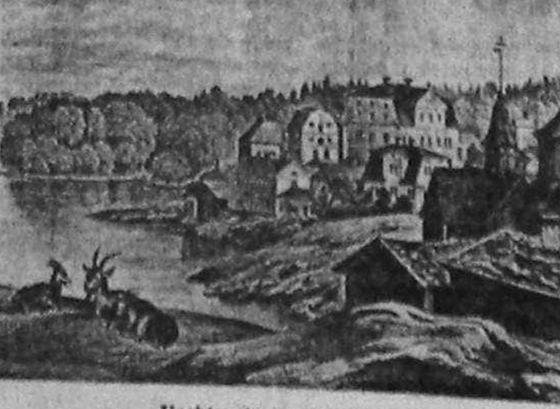
Vechi paisaj urban finlandez