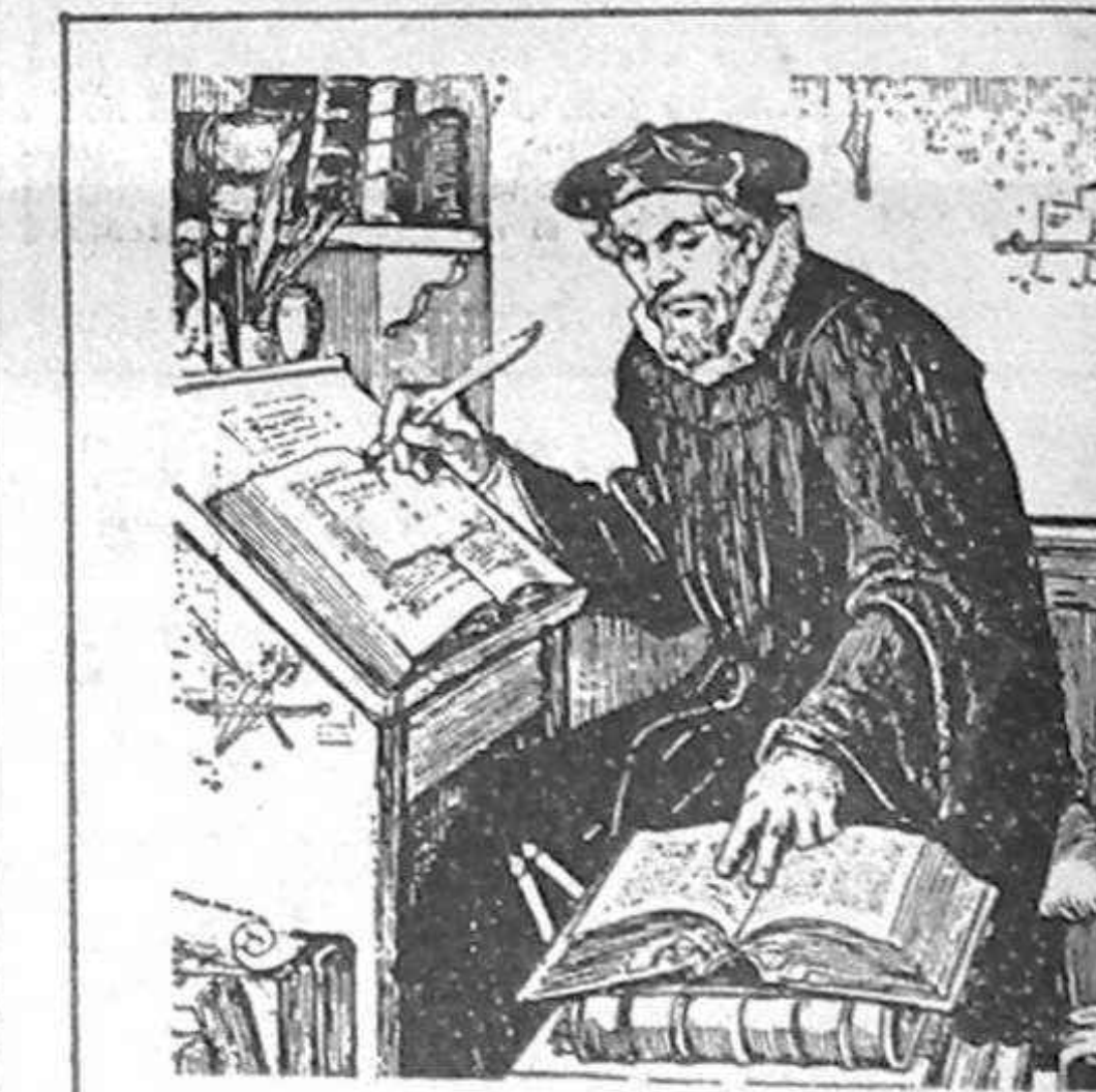
Mikael Agricola (1510-1557)