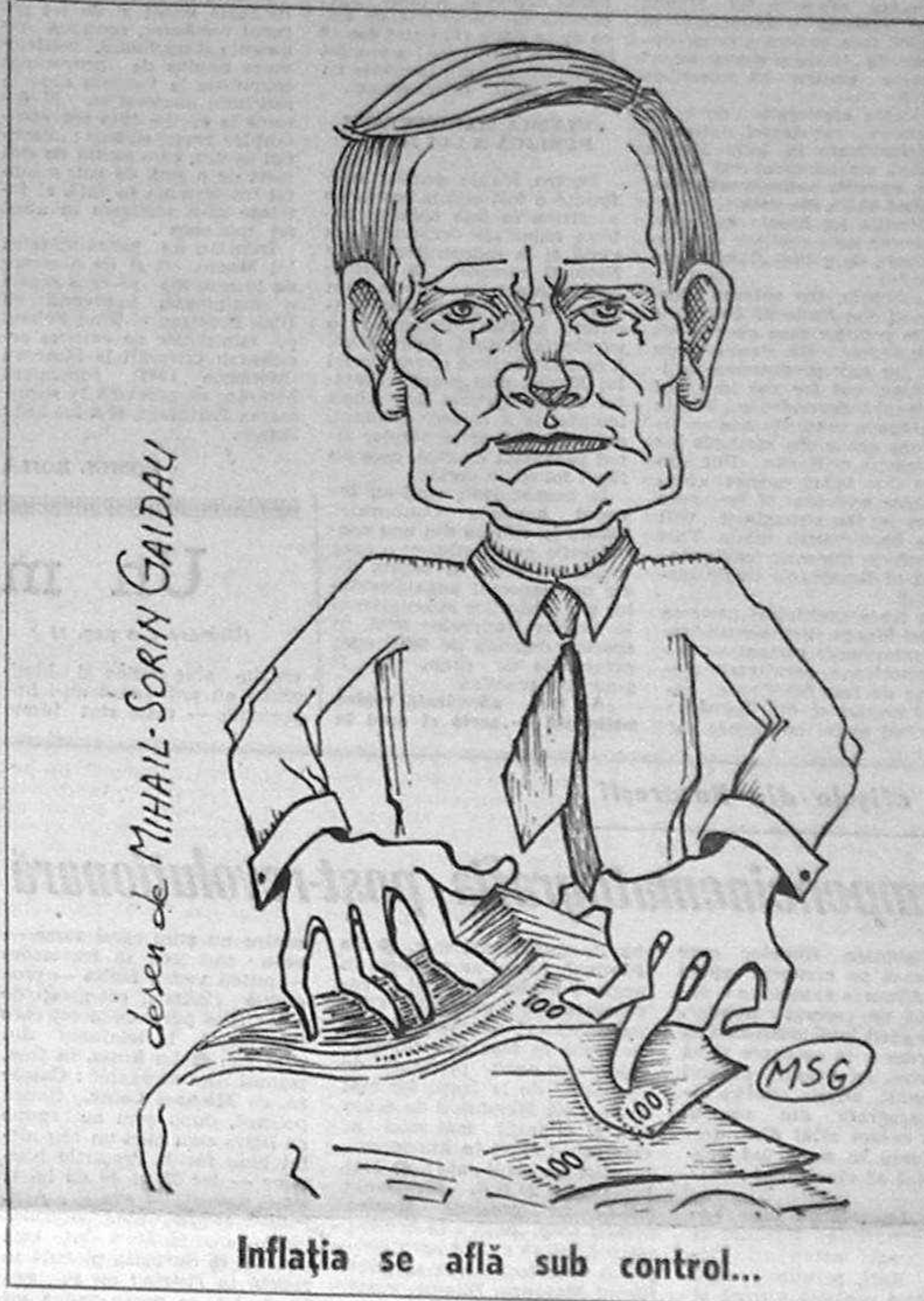
desen de MIHAIL-SORIN GAIDAU