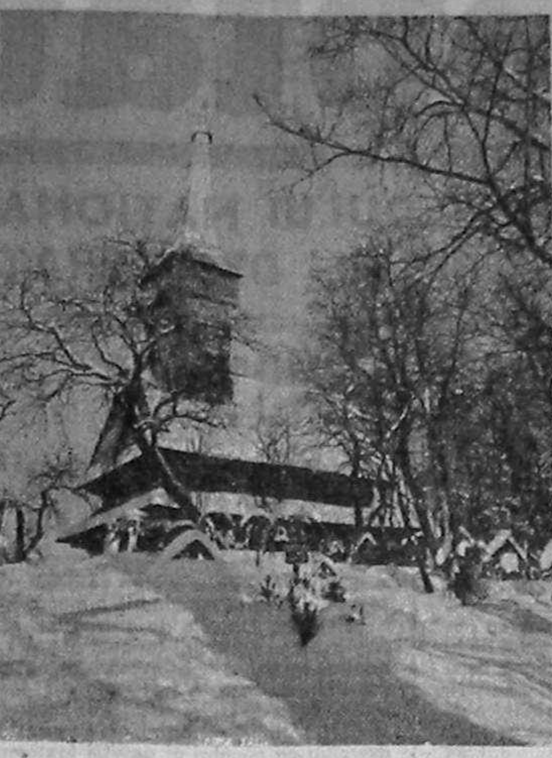
Biserica din Desesii, Sighetu Marmatiei