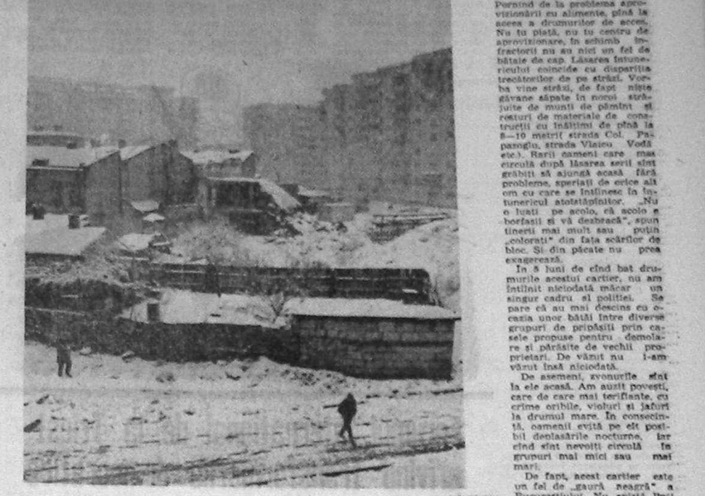
Traseul Piața Unirii — Piața Muncii, pe Bulevardul Artera Nouă Est-Vest, este, cu toate pierderile de căldură...