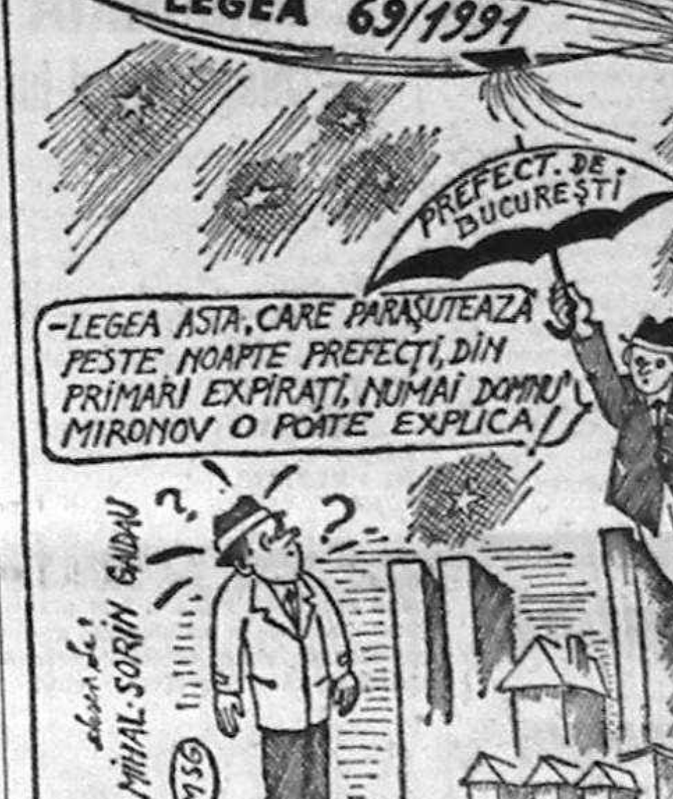
„LEGEA ASTA, CARE PARĂȘITEAZĂ PESTE NOAPTE PREFECȚI, DIN PRIMĂRII EXPIRĂTI, NUMAI DOMNUL MIRONOV O POATE EXPLICA!”