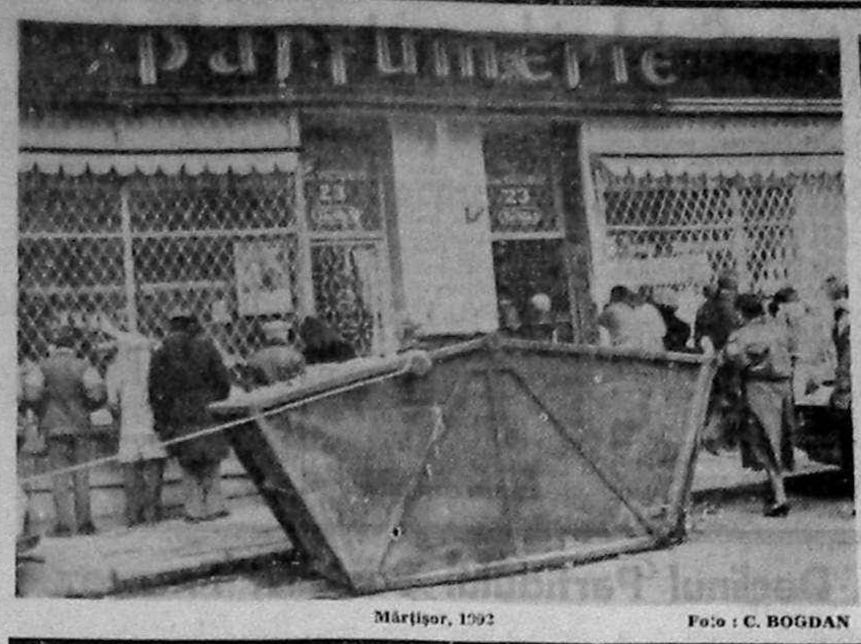
Mărtisor, 1992

...ca deosebit de desigur, Liga Națională a Femeilor nu poate face parte din structura actuală a organizației. Este vorba de o problemă organizatorică, nu de principii. Pentru ca Liga să funcționeze precum trebuie, trebuie să se realizeze o schimbare de structură. În acest sens, Liga Națională a Femeilor este în discuție. Așa cum s-a spus în declarațiile făcute de doamna Smaranda Ionescu, Liga Națională a Femeilor este în discuție. Așa cum s-a spus în declarațiile făcute de doamna Smaranda Ionescu, Liga Națională a Femeilor este în discuție. Așa cum s-a spus în declarațiile făcute de doamna Smaranda Ionescu, Liga Națională a Femeilor este în discuție.