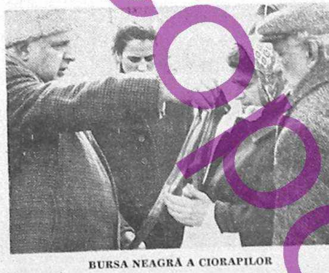
BURSA NEAGRĂ A CIORAPILOR

Vizită la o societate cu acționar unic - statul... (Text partially obscured by handwritten notes)