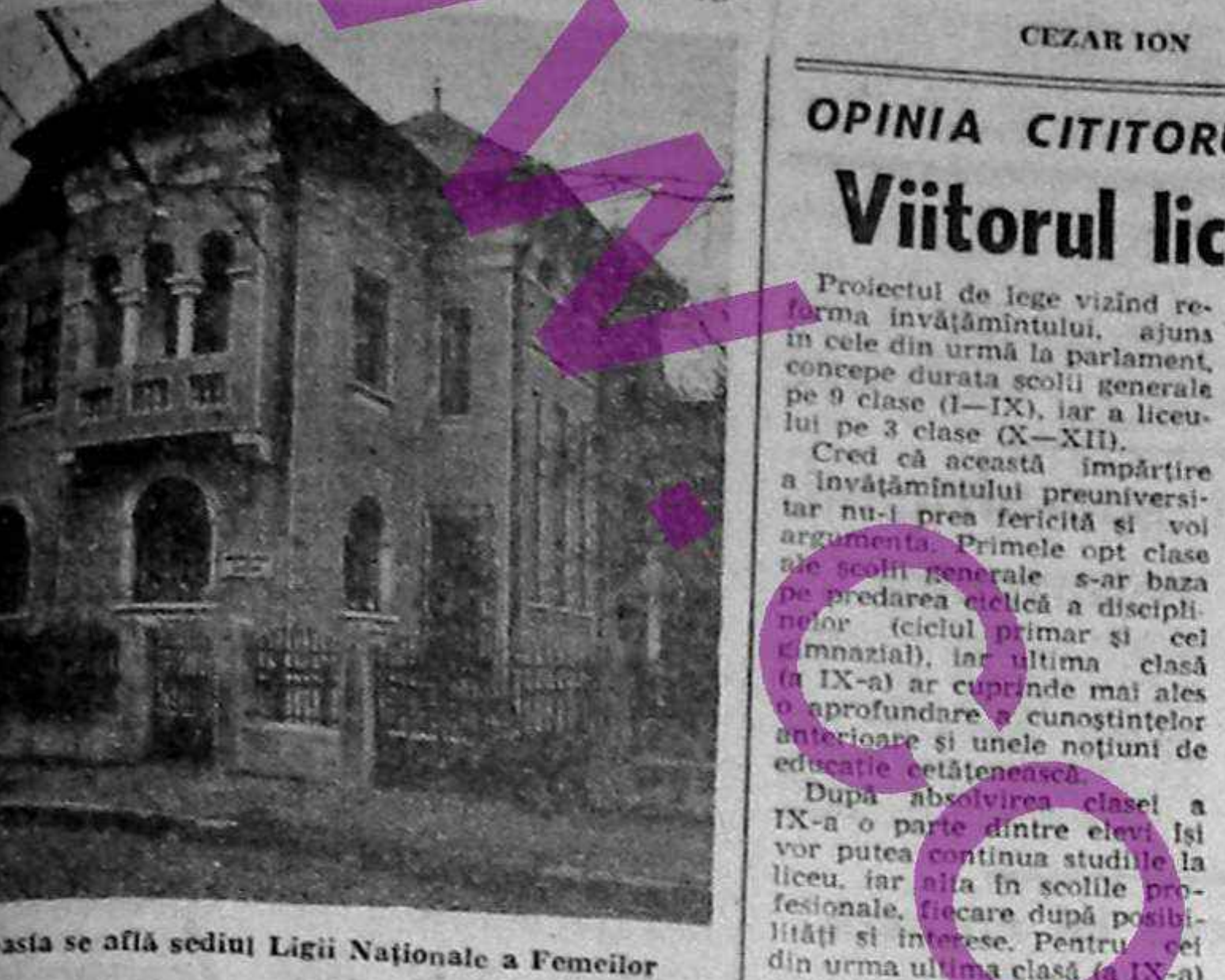
Acesta se află sediul Ligii Naționale a Femeilor

...membrii Ligii din această... Dar oare Liga mai există... (Text continues with details about the National Women's League and its activities, mentioning various members and their contributions.)