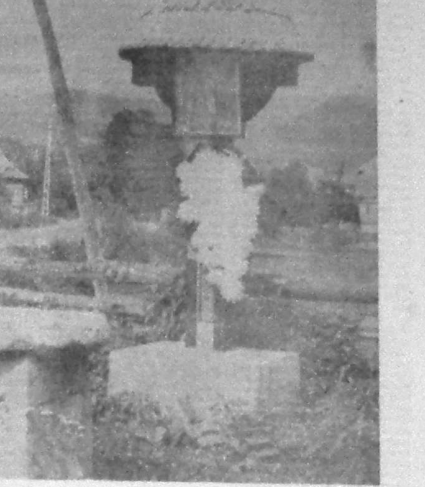
La răscruce de drumuri

Am ales intențional, așa cum în-aș fi putut să fac, un post de televiziune din România în scopul de a prezenta în mod corect și obiectiv activitatea acestor organizații.