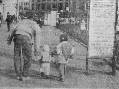
C. BARBU (Continuare în pag. a 3-a)

De multe ori, pe care în cazul în care... Conferința de presă a avut loc la Palatul Național, în prezența unor oficialități importante.