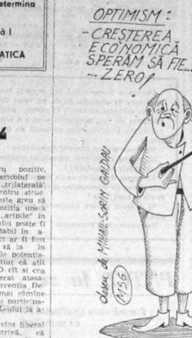
Optimism: Creșterea economică sperăm să fie... ZERO!

De când s-au privatizat întreprinderile, de când s-a schimbat lumina din temelii, creșterea de copii... Este o sarcină complexă care implică colaborarea dintre părinți, medicii și autoritățile locale pentru asigurarea unei îngrijiri adecvate copiilor.