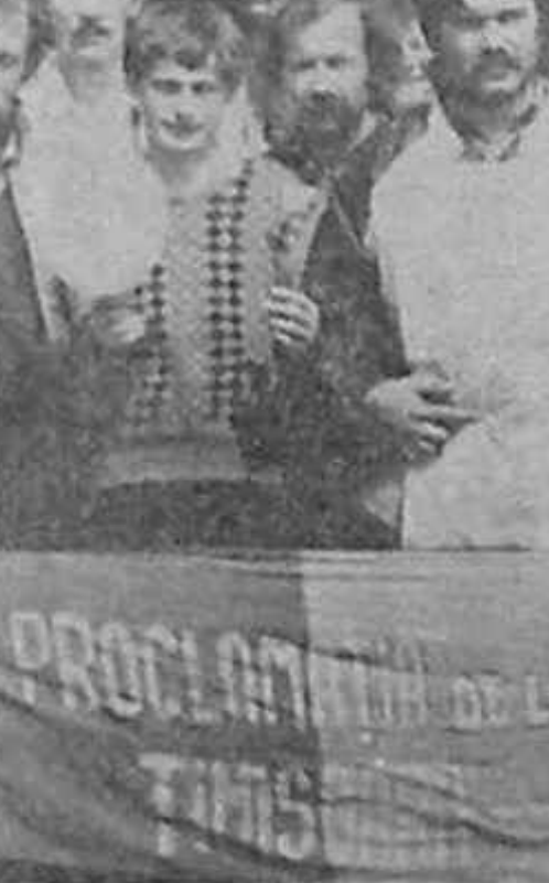
ting. Doar în sinul acestui partid am certitudinea că sint cu adevărat liberi și pot să mă exprim. Niciodată de la Revo-

L. G.: De când m-am înscris în partid aștept acest mi-