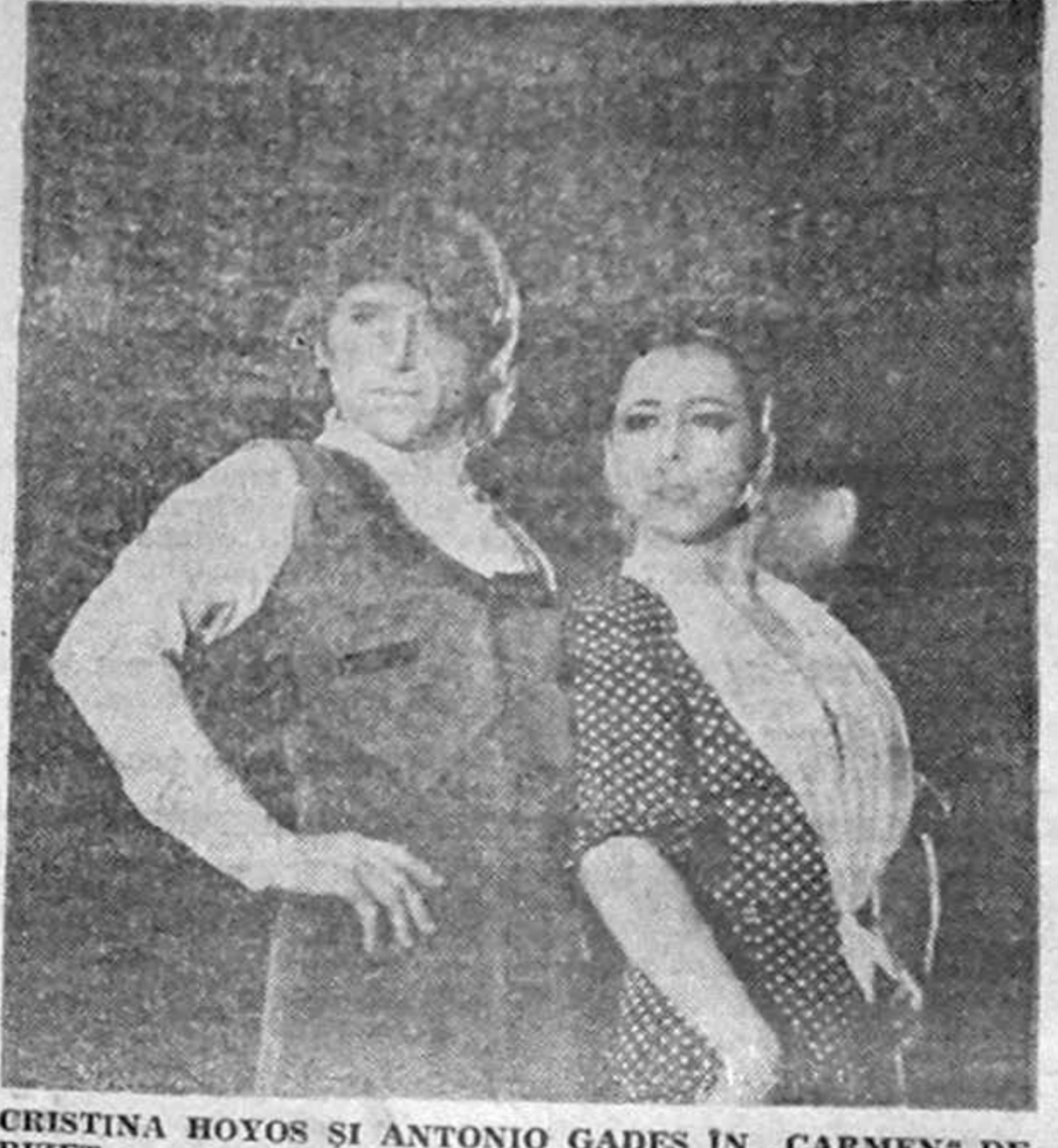
CRISTINA HOYOS ȘI ANTONIO GADES ÎN „CARMEN” DE BIZET - opera simbiozei dintre flamenco și literatura franceză