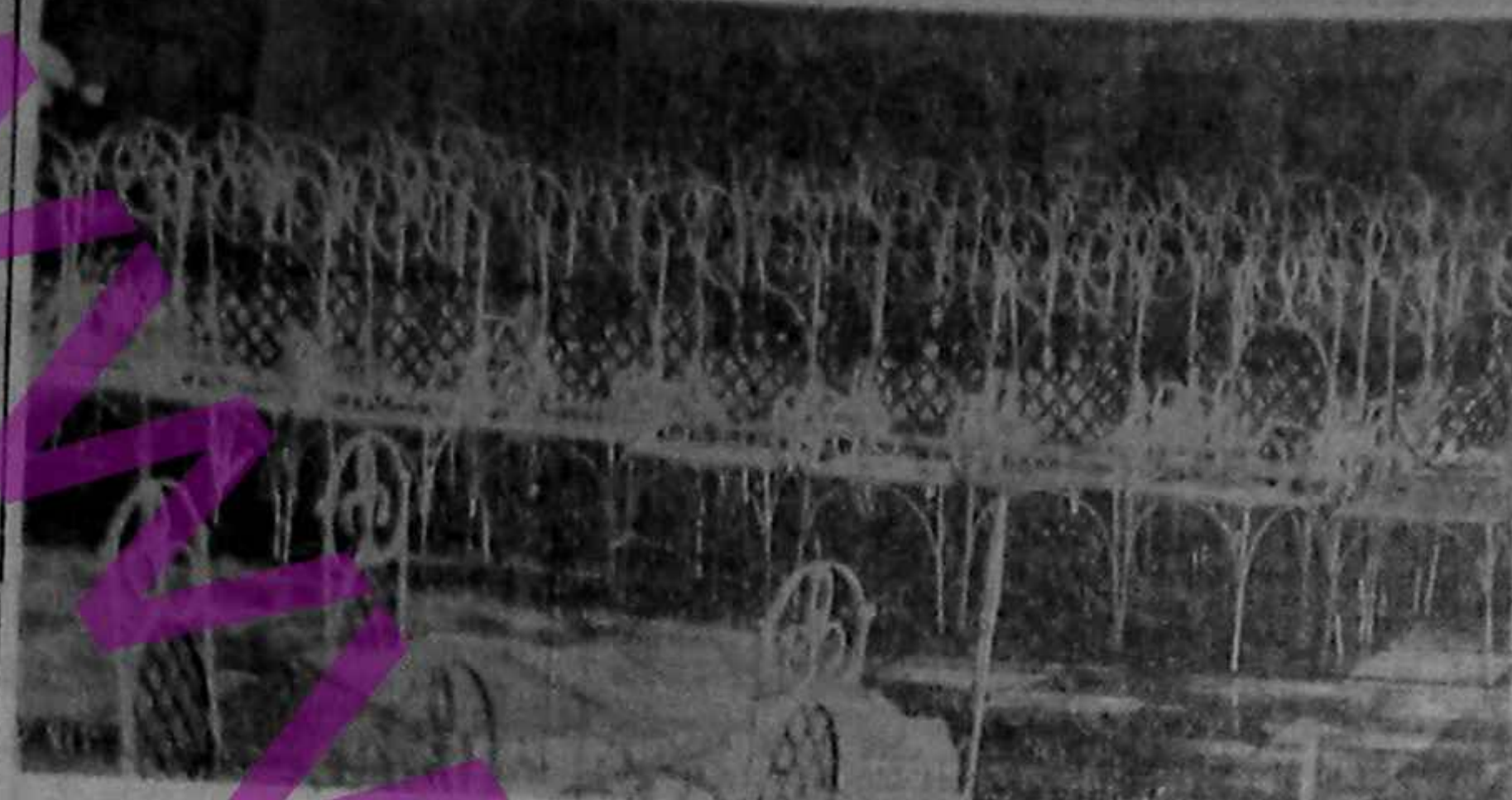
Parlamentul în vacanță